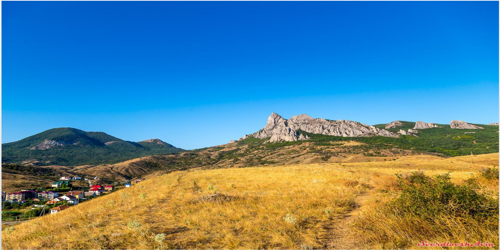
Кара-Даг, посёлок Коктебель.