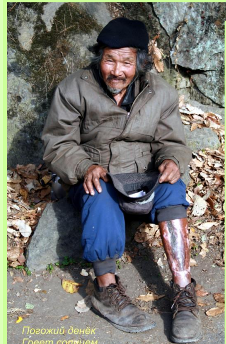
Погожий денёк Греет солнцем