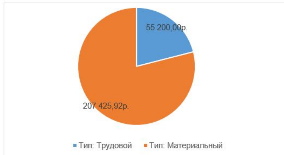
Рисунок 3 Обзор затрат на ресурсы