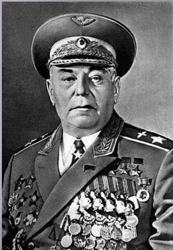
А. ПОКРЫШКИН (ЛЕТЧИК-АС)