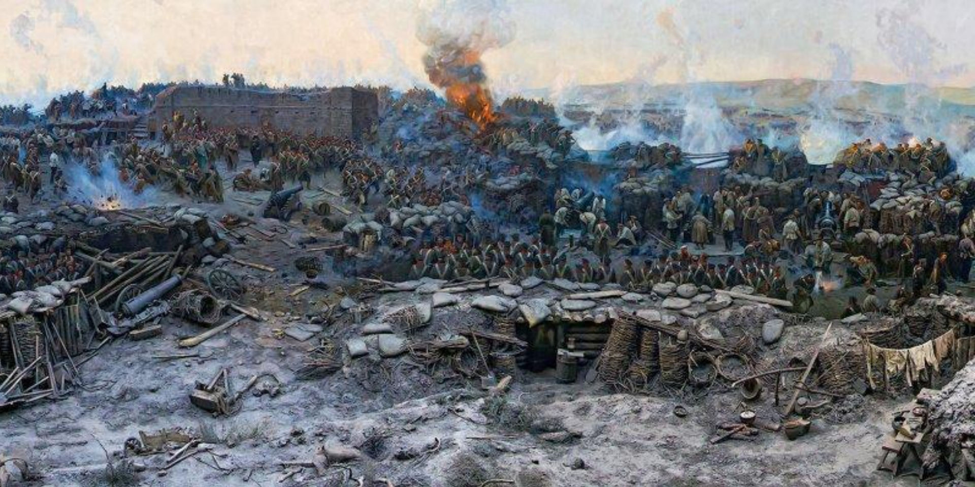
Ф.РУБО «ОБОРОНА СЕВАСТОПОЛЯ» (ФРАГМЕНТ ПАНОРАМЫ)