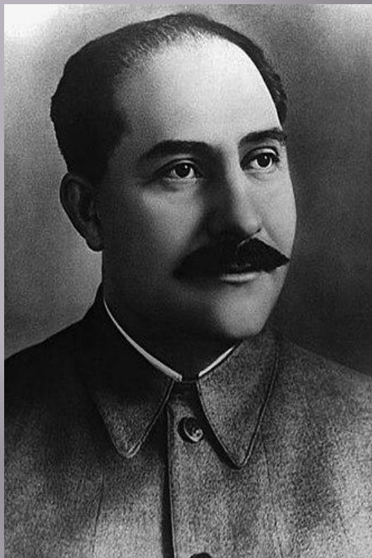
КАГАНОВИЧ ЛАЗАРЬ (ПРЕДСЕДАТЕЛЬ)