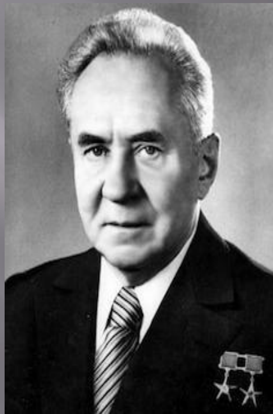
КОСЫГИН АЛЕКСЕЙ (ЗАМЕСТИТЕЛЬ ПРЕДСЕДАТЕЛЯ)