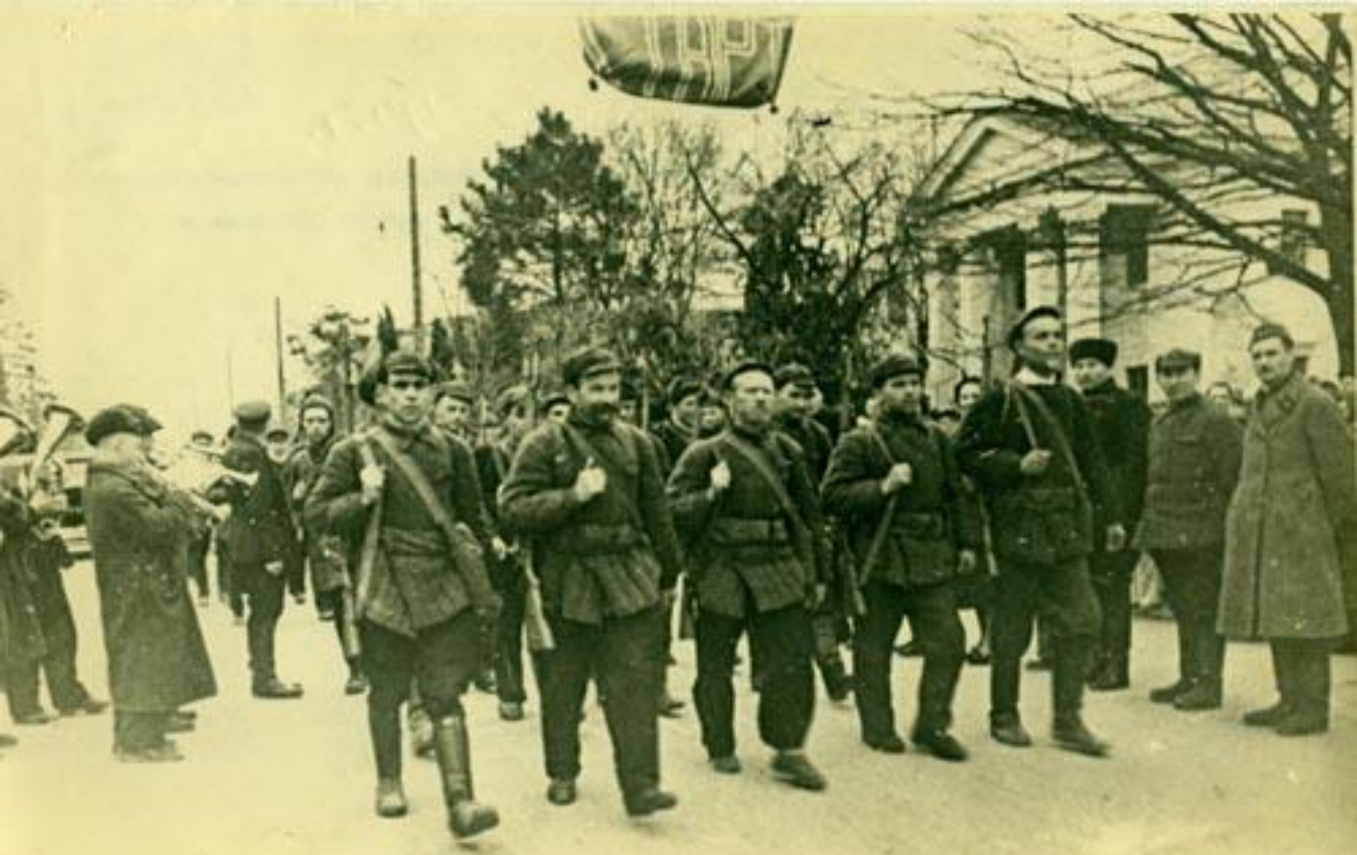
Народное ополчение на территории Краснодарского края. 6 июля 1941 г.