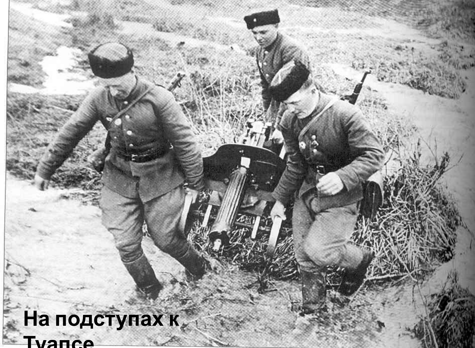
На подступах к Туапсе