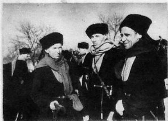
КАЗАКИ-БУДЕНОВЦЫ, УЧАСТНИКИ РАЗГРОМА НЕМЦЕВ ПОД РОСТОВОМ В 1918 Г.