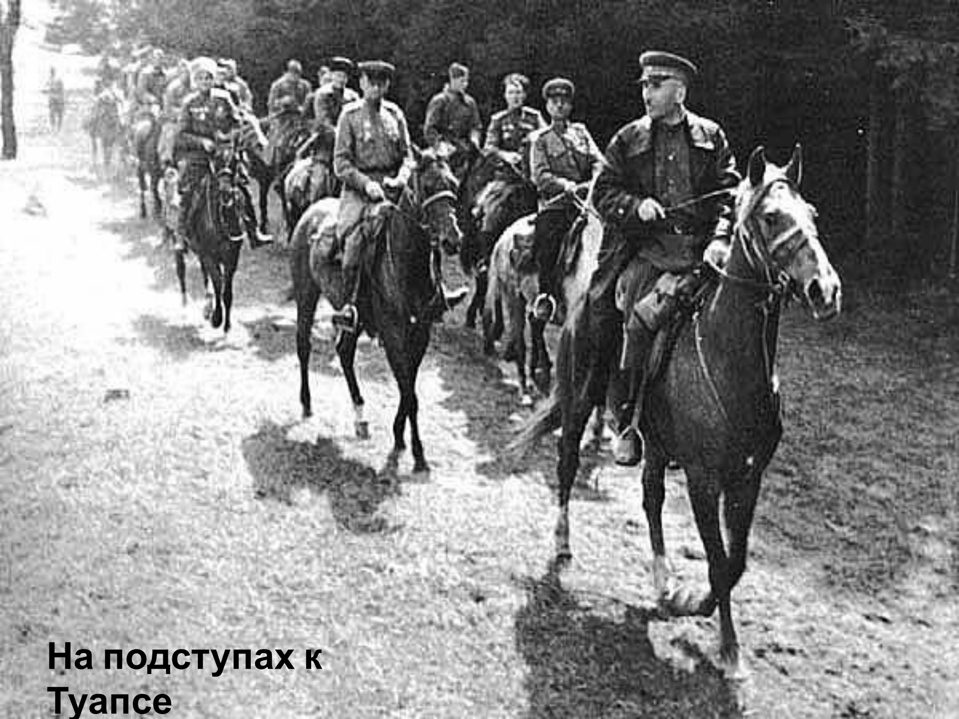
На подступах к Туапсе