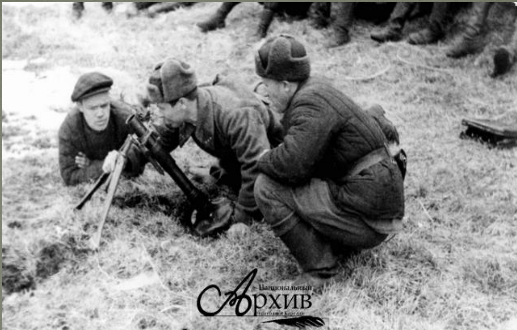
Бойцы партизанского отряда «Вперед» изучают устройство нового миномета. Тунгудский район, д. Лехта. 1942 г.