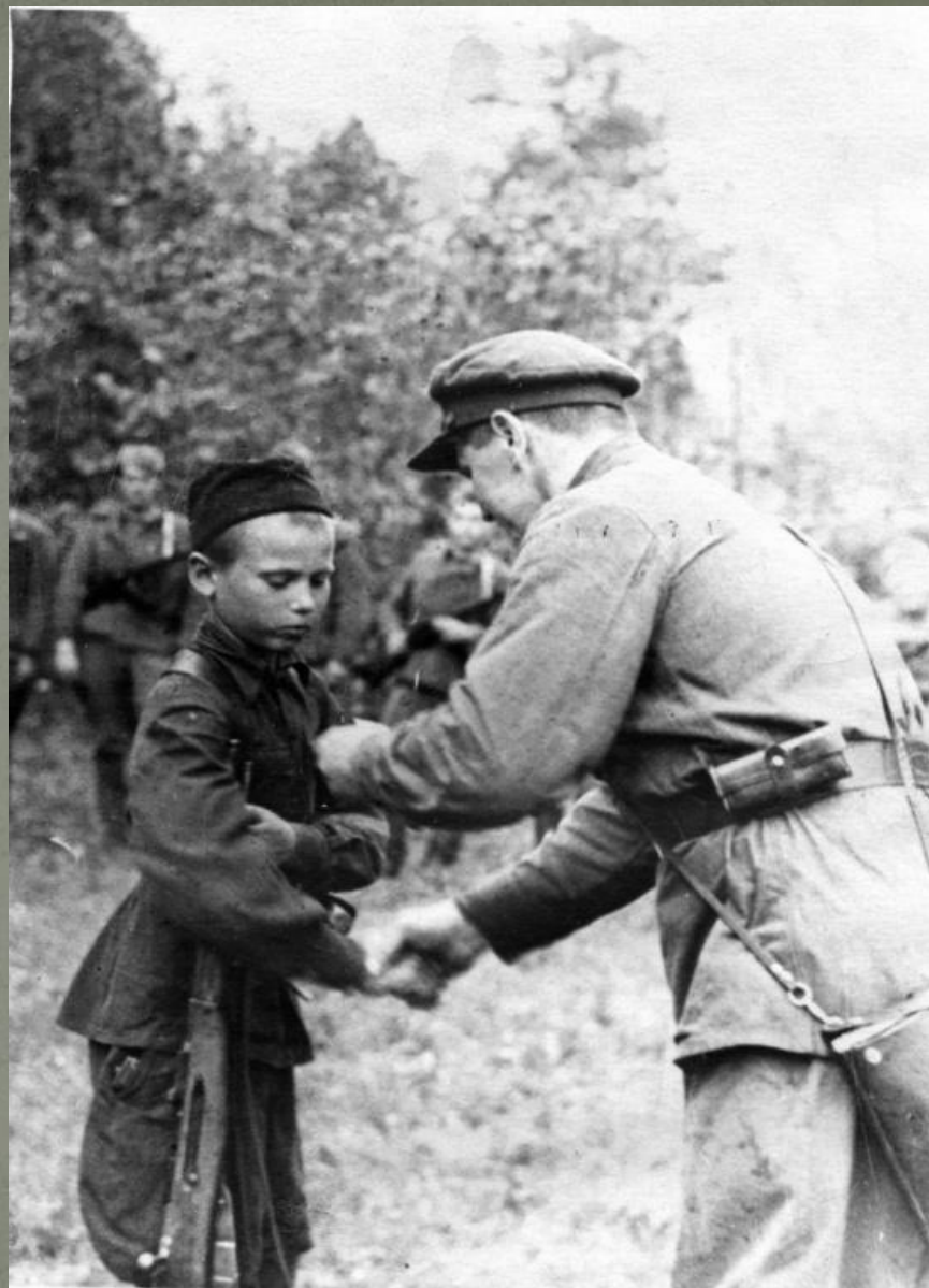
Командир партизанского отряда вручает медаль «За отвагу» юному партизану-разведчику

За героизм и мужество, проявленные в годы суровых испытаний, тысячи патриотов были награждены орденами и медалями, 249 – присвоено звание Героев Советского Союза, а С.А.Ковпаку и А.Ф. Федорову это звание было присвоено дважды.