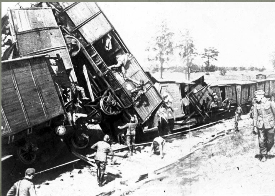
Крушение немецкого военного эшелона, организованного одним из отрядов партизан

По своим масштабам «Рельсовая война» приобрела стратегический характер. Начатая в ночь на 3 августа 1943 года в разгар ожесточенного сражения на Курской дуге, она развернулась на огромном пространстве протяженностью по фронту на 1000 км и в глубину 750 км, и продолжалась до середины сентября 1943 года. В операции приняли участие около 100 тысяч бойцов партизанских формирований и десятки тысяч человек мирного населения.