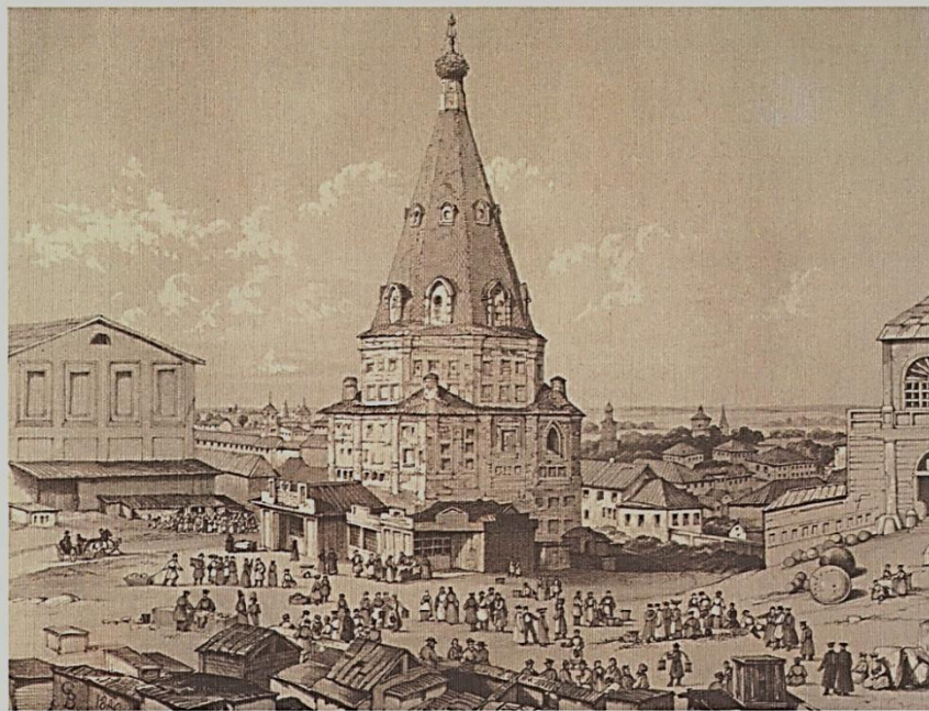
Э.Турнерелли 8. Кунак саркендагы манара Edward P. Turnerelli Башня в Гостином дворе Tower in the market place. Kazan