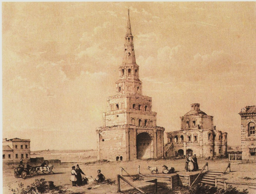
Э.Турнерелли 2. Соембикэ манарасы Edward P. Turnerelli Башня Сююмбеки Tower of Siumbika