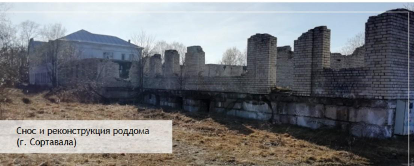
Снос и реконструкция роддома (г. Сортавала)