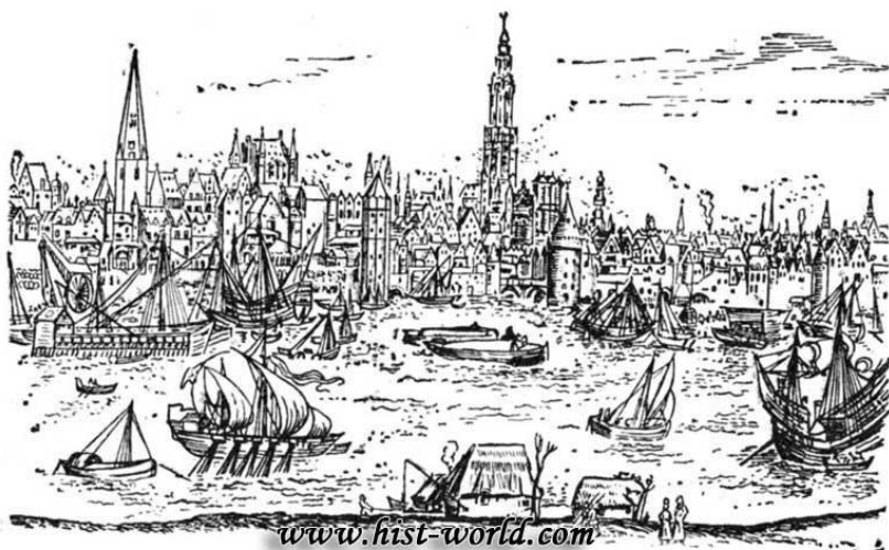
Город Антверпен и его гавань (XVI век).

В гаванях Антверпена ежедневно разгружалось до 250 кораблей. В течение месяца в этом городе совершалось больше торговых сделок, чем за два месяца в Венеции Антверпен стал «воротами Европы», через которые непрерывно поступали заморские товары.