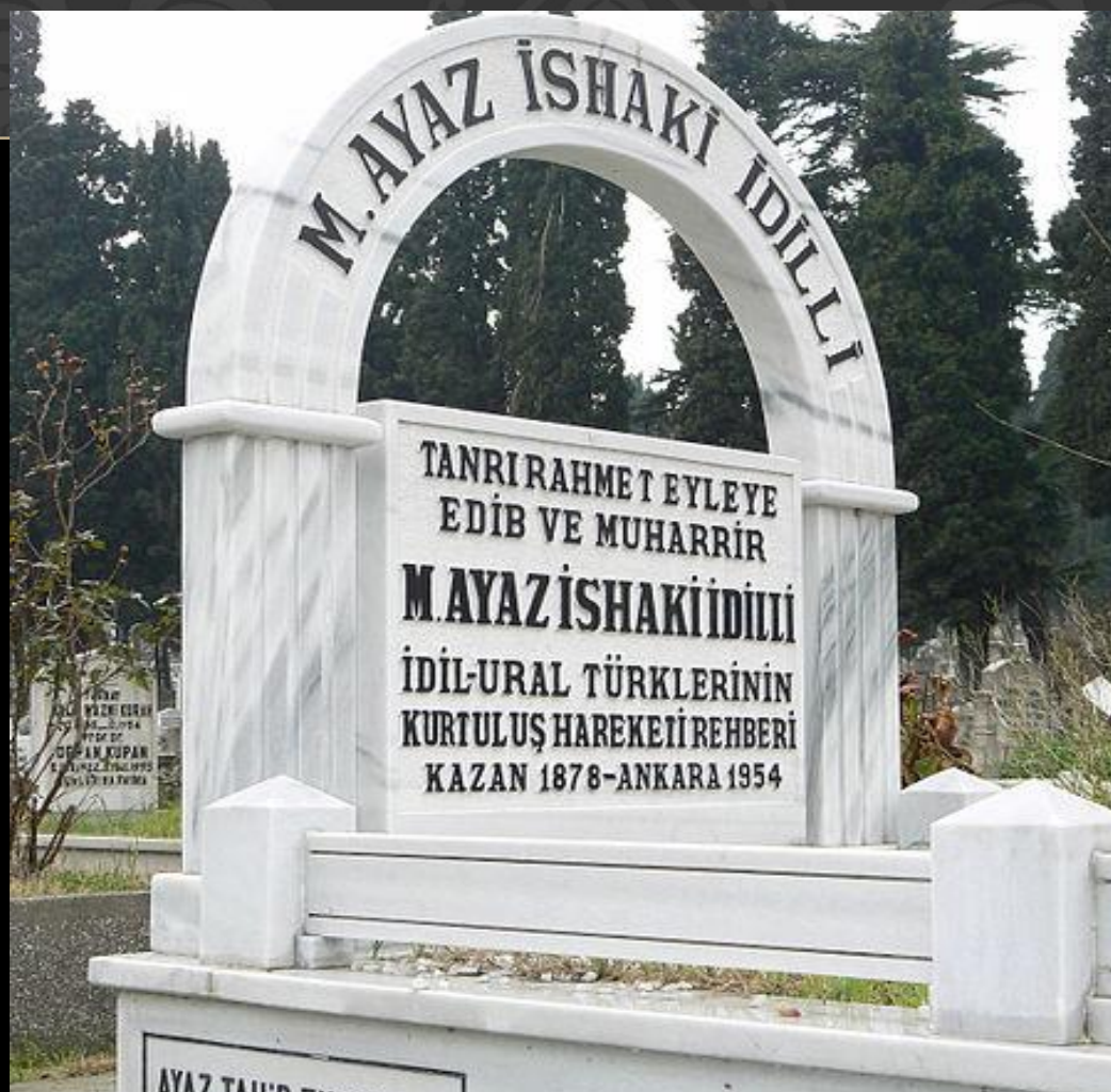
Гаяз Исхакый кабере. Әдирнәкапы, Төркия