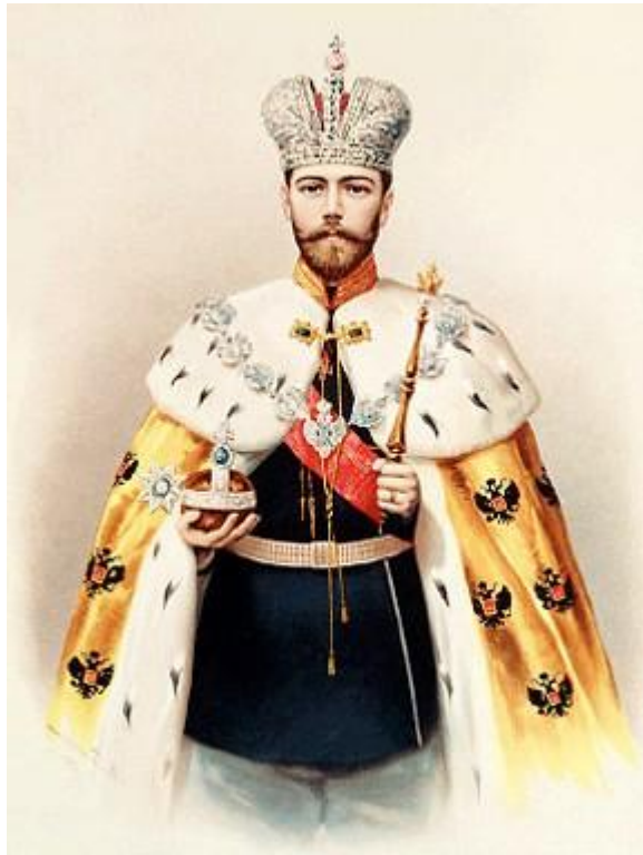
Царь Николай II