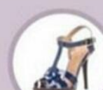
Босоножки с T-образным креплением