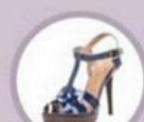
Босоножки с T-образным креплением