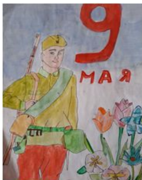
Хусаинова Сафина, 5 Г