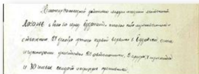
Описание подвига при взятии Будапешта

Прадедущка прошел огромный боевой путь. Будучи призванным в Пензенской области, был отправлен в Тверскую область, где начал свою службу в составе 2-го гвардейского механизированного корпуса. Прошел Калужскую, Тульскую, Орловскую области, Елец, Воронеж, Ростовскую область и Ростов-на-Дону, Донецкую, Запорожскую, Херсонскую, Николаевскую, Одесскую области, Румынию, Венгрию.