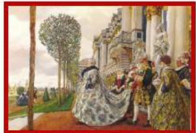
Императрица Елизавета Петровна в Царском Селе Е. Е. Лансере