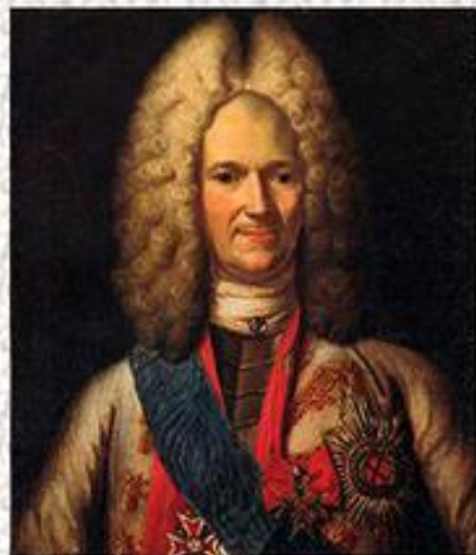
А. Д. Меншиков