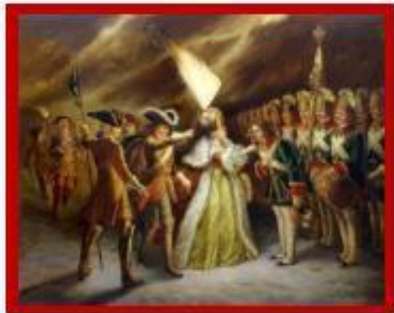
Филипп М.Р. Присяга преображенцев дочери Петра Великого.