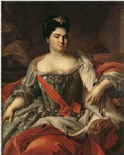
Екатерина I (1725 -1727гг.)