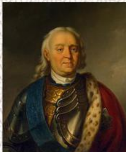
Ф. М. Апраксин

Верховный тайный совет — высшее совещательное государственное учреждение Российской империи в 1726—1730 гг. в составе 7-8 человек. Создан императрицей Екатериной I как совещательный орган, фактически решал важнейшие государственные вопросы.