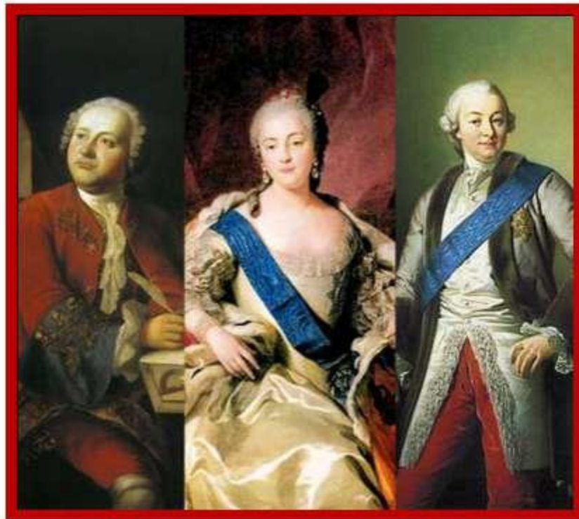
Михаил Васильевич Ломоносов, императрица Елизавета Петровна, Иван Иванович Шувалов.