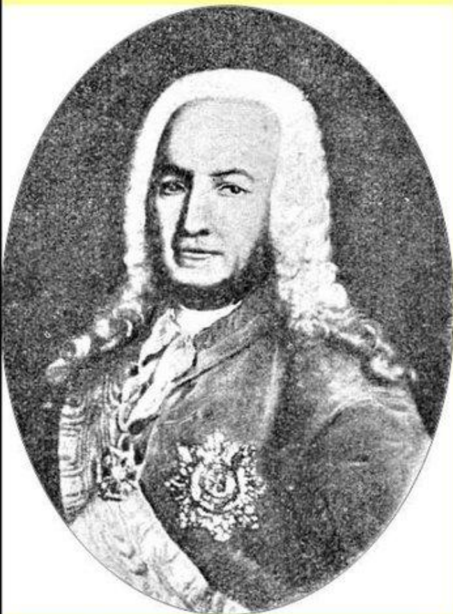
Андрей Иванович Ушаков, начальник тайной канцелярии.

Самым страшным человеком анненской эпохи, главным палачом-кнутобойцем был не немец, а русский дворянин А.И. Ушаков, возглавлявший орган политического сыска – Тайную канцелярию .