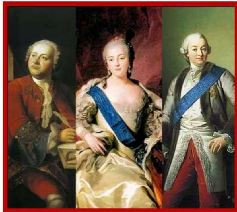
Михаил Васильевич Ломоносов, императрица Елизавета Петровна, Иван Иванович Шувалов.