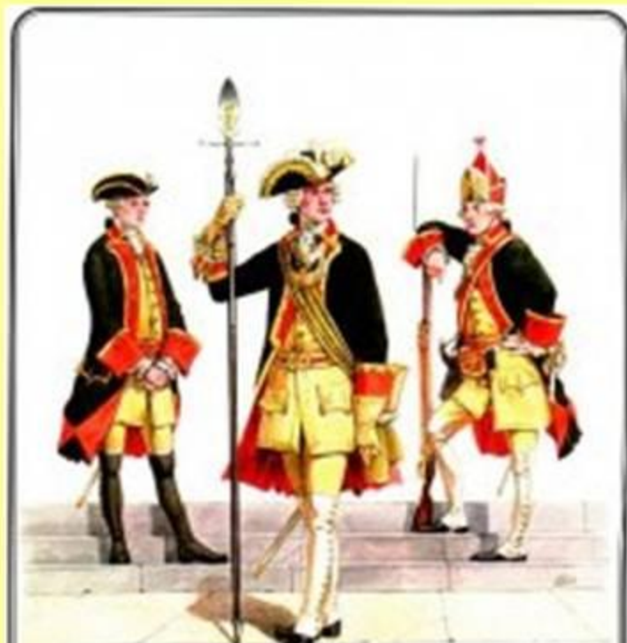
Кадеты: фузилер, офицер и гренадер.

Таким образом, у дворян появилась возможность избавиться от ненавистной службы рядовыми наряду с лицами «подлых» сословий. В Корпусе обучали не только военному делу, но и основам наук.