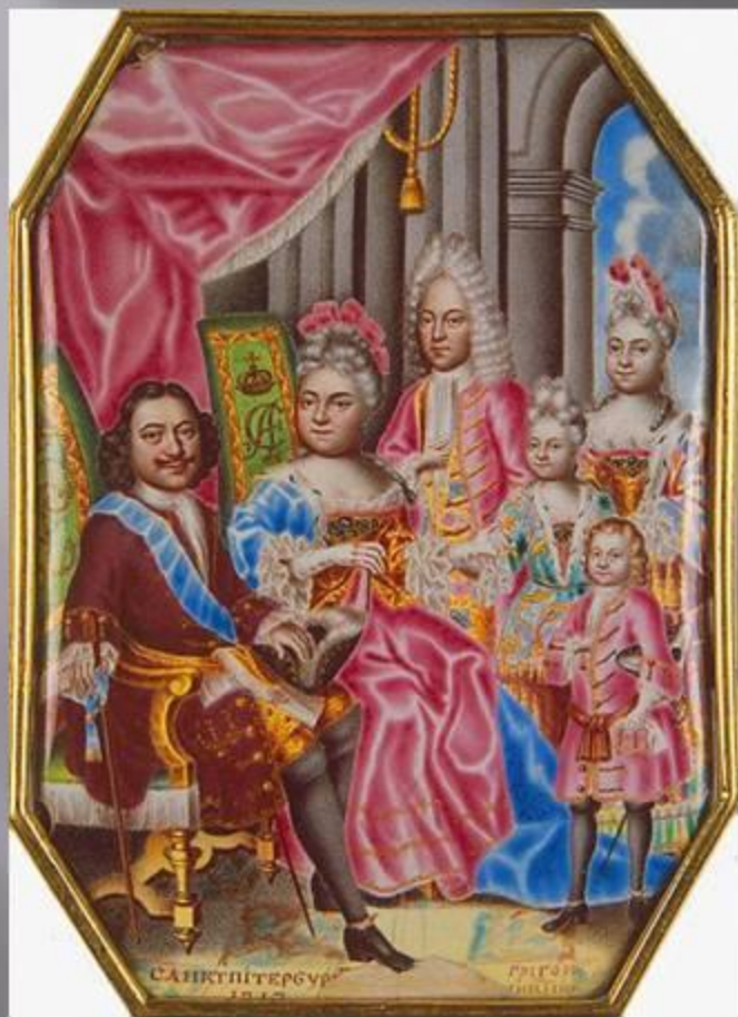
Император Пётр I с Екатериной и детьми

В последние годы царствования Петра Великого встал вопрос о престолонаследии: кто займёт трон после смерти императора.