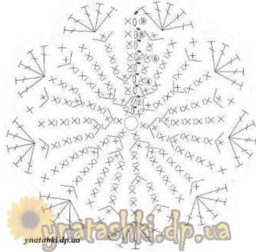
Схема обвязки краев

Можно взять атласную ленточку, и пришить к игольнице по периметру. Так вязаная шляпка будет смотреться интереснее. Ленточку украсить небольшим бантиком или маленьким цветочком.