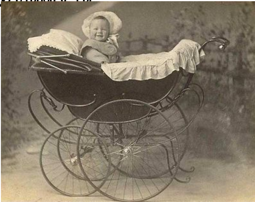
Детская коляска, конец XIX века

18 июня 1889 года в балтиморское патентное бюро пришел Уильям Ричардсон, чтобы закрепить права на свое изобретение - реверсивную детскую коляску. По сути, были запатентованы сразу два усовершенствования - поворотный механизм, позволяющий изменять положение ребенка в коляске (спиной или лицом к родителям), и механизм колесных осей, обеспечивающий независимое вращение каждого колеса для лучшей маневренности и проходимости.