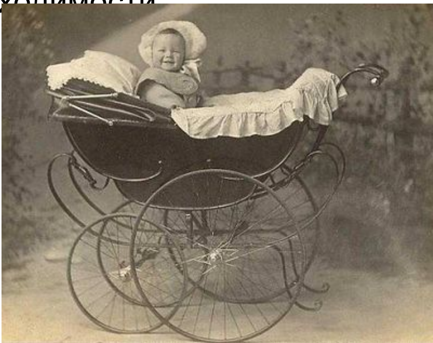
Детская коляска, конец XIX века

18 июня 1889 года в балтиморское патентное бюро пришел Уильям Ричардсон, чтобы закрепить права на свое изобретение - реверсивную детскую коляску. По сути, были запатентованы сразу два усовершенствования - поворотный механизм, позволяющий изменять положение ребенка в коляске (спиной или лицом к родителям), и механизм колесных осей, обеспечивающий независимое вращение каждого колеса для лучшей маневренности и проходимости.