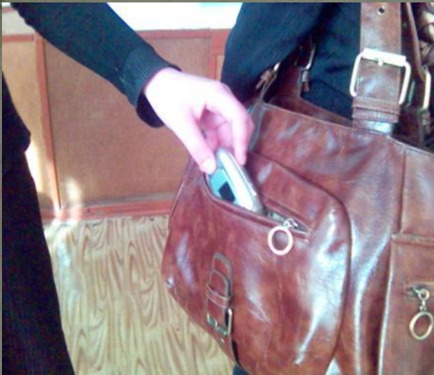
Статья 175 Кража