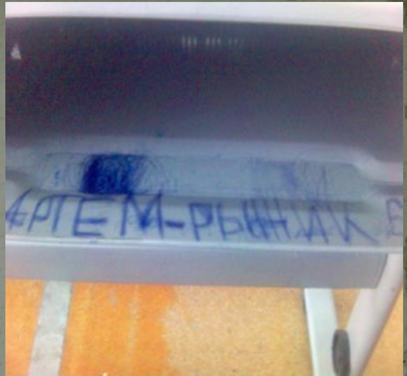
статья 258 Вандализм