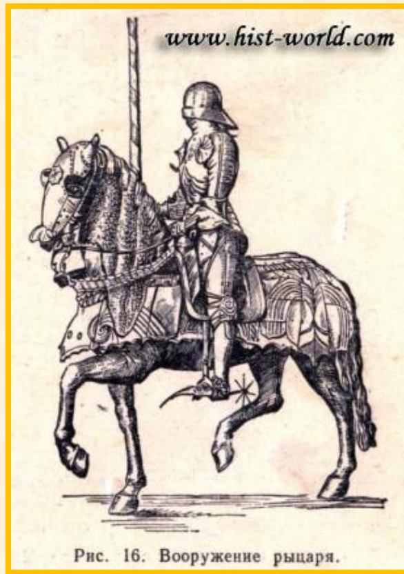
Рис. 16. Вооружение рыцаря.