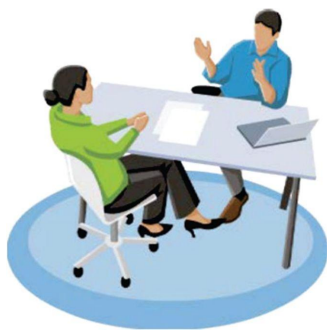
Схема получения кредита