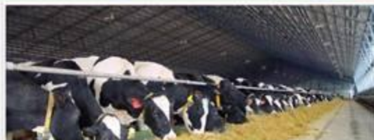
ФОТО ДЛЯ СМИ

ПРОВОД-СЛУЖБА ГУБЕРНАТОРА И ПРАВИТЕЛЬСТВА