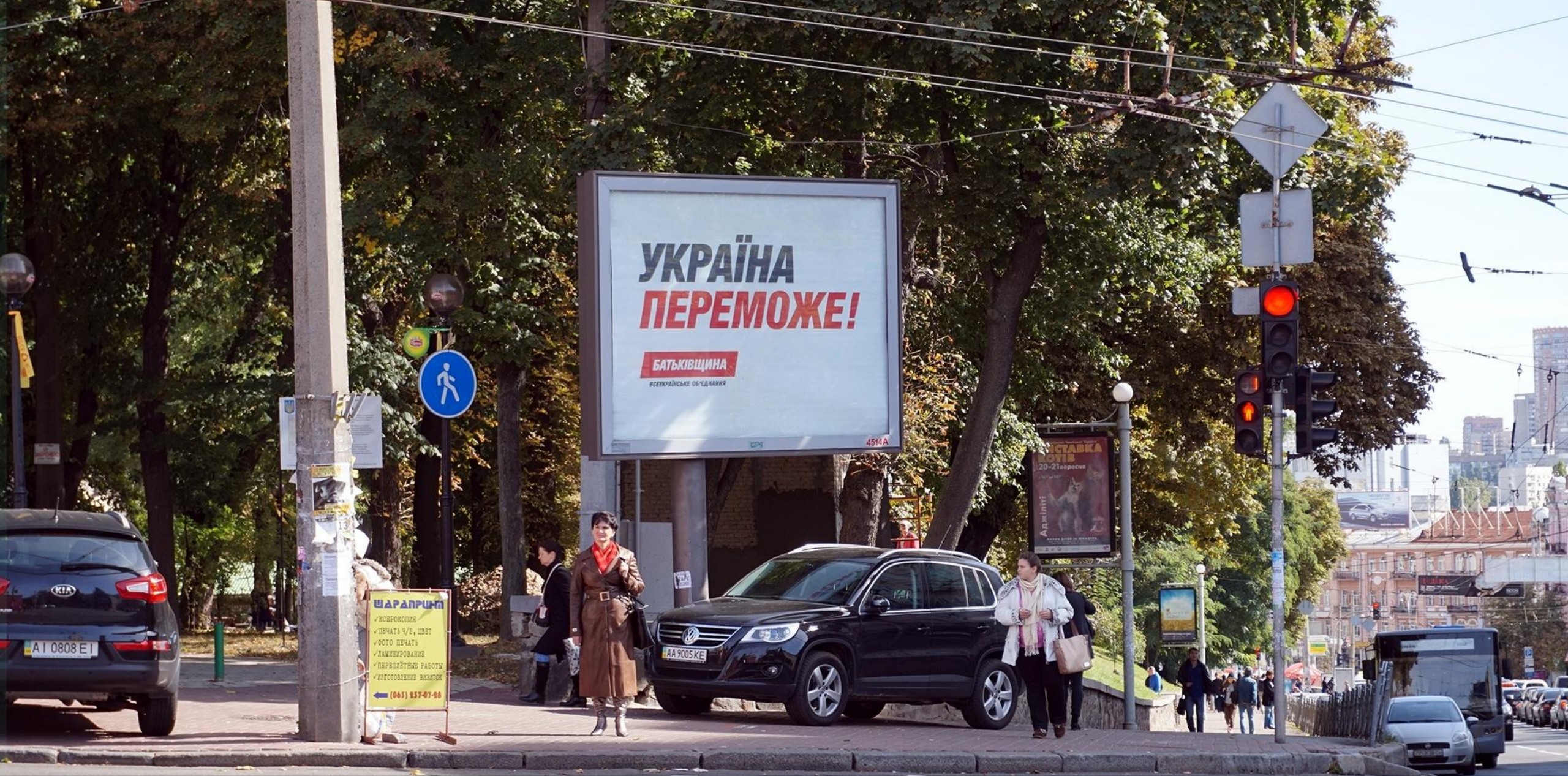
Борды партии "Батьківщина" около университетского парка на улице Владимирской в Киеве.