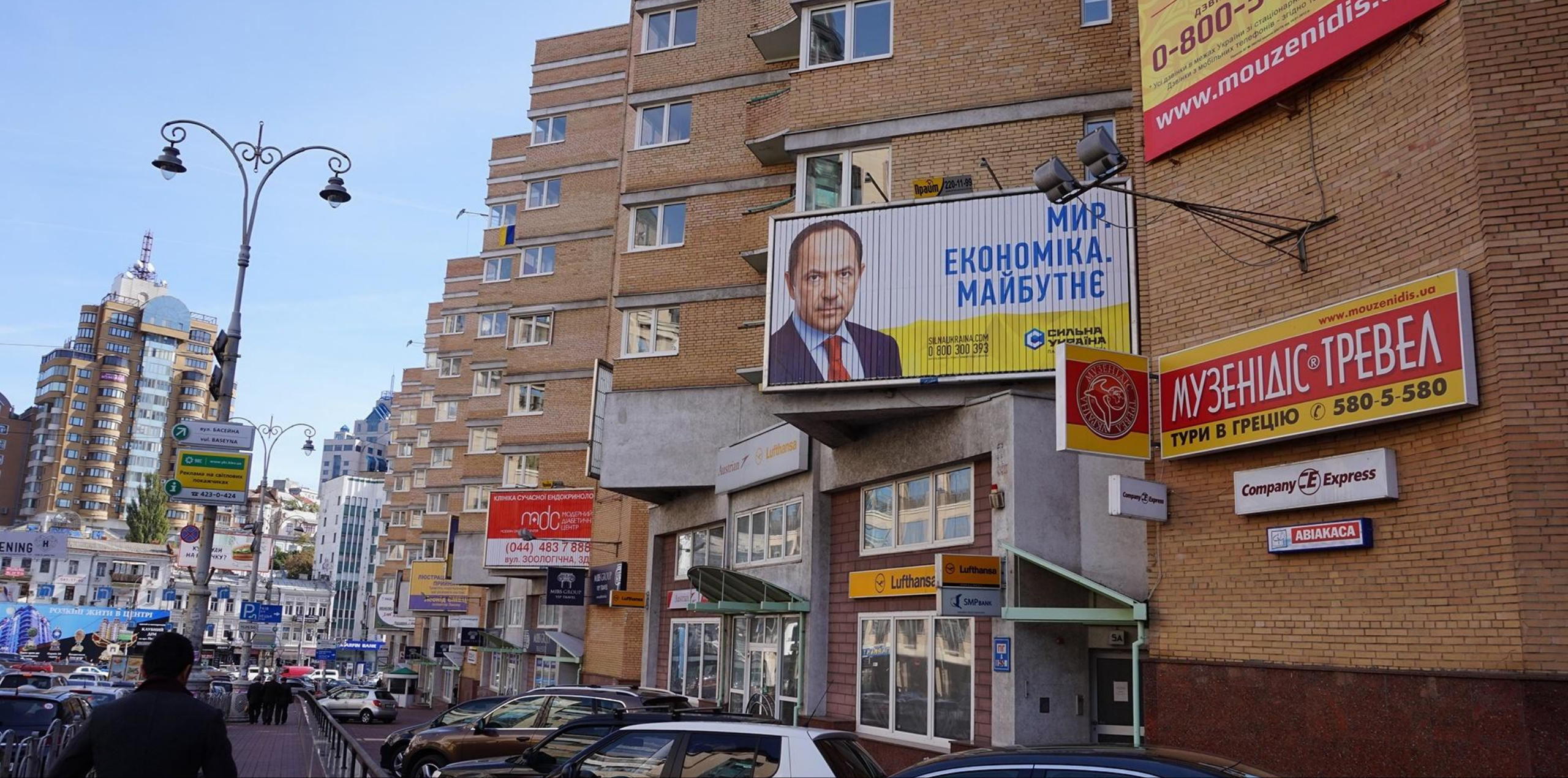
Щит "Сильной Украины" (на заднем фоне видна другая политическая реклама) в районе Бессарабского рынка и "Арена"-Сити в центре Киева.