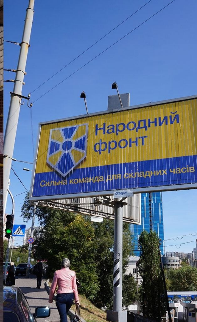
Партия Арсения Яценюка "Народный фронт" активно и обильно рекламируется в Киеве. Постеры в основном без лиц; разыгрывается "пюстрационная карта"