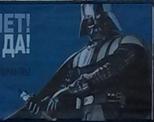
Щит Интернет-партии на Краснозвездном проспекте в Киеве.