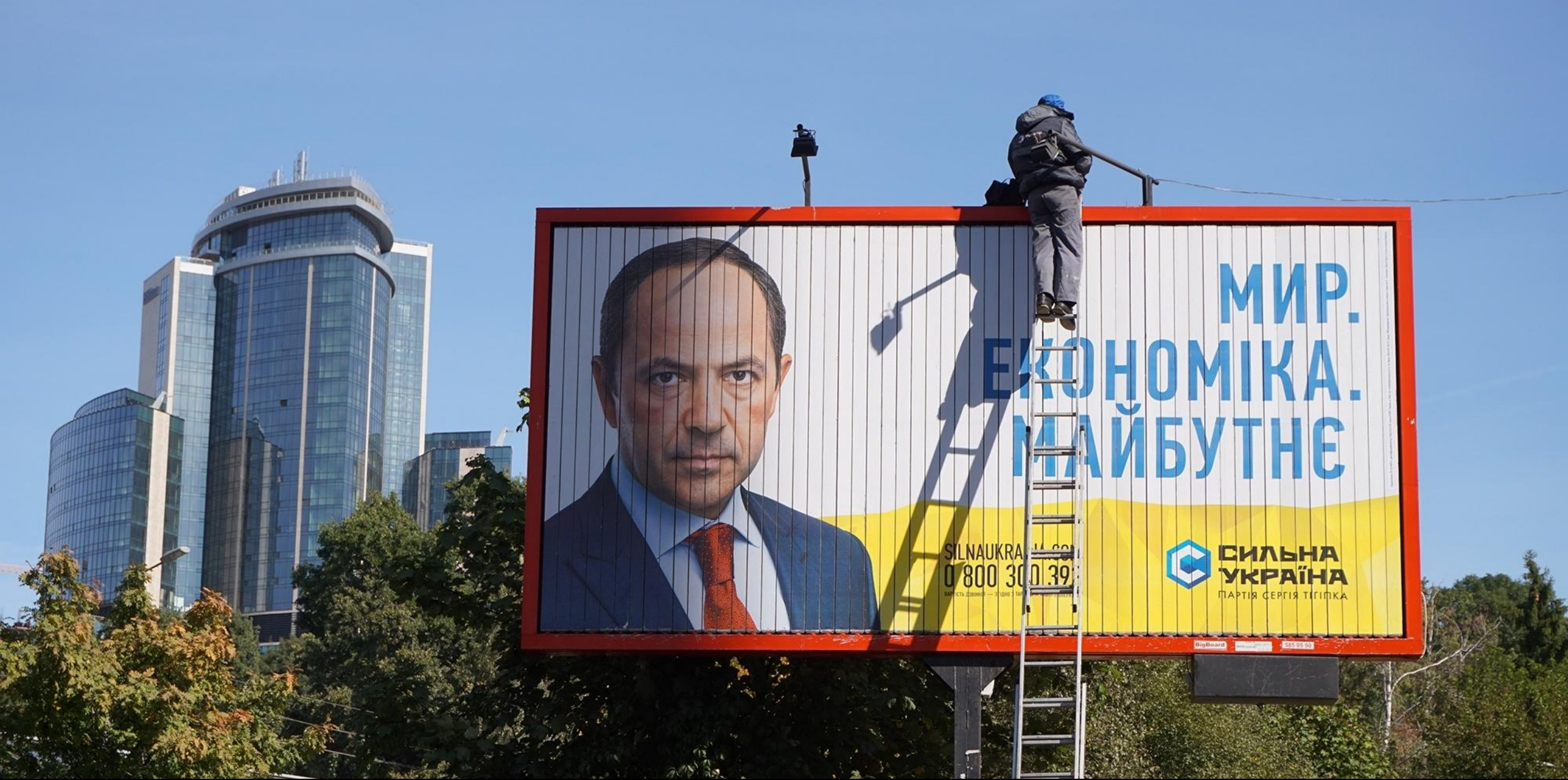
Мир, економіку и будуще обещает украинцам Тигипко на одном из щитов на улице Ветрова около старого ботанического сада в Киеве.