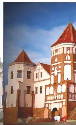
Замковый комплекс «Мир»