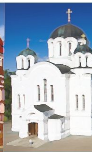
Полоцкий историко- культурный музей- заповедник