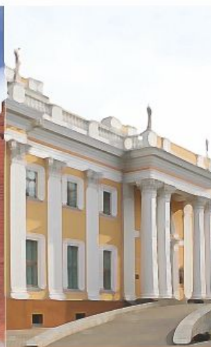
Гомельский дворцово- парковый ансамбль