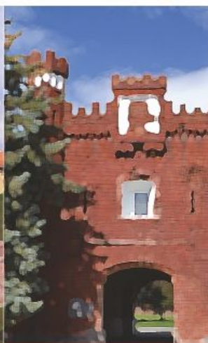
Комплекс «Брестская крепость-герой»