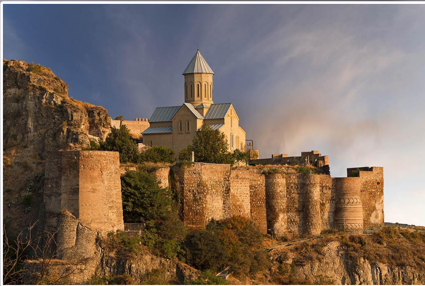
Крепост Ъ Нарикала