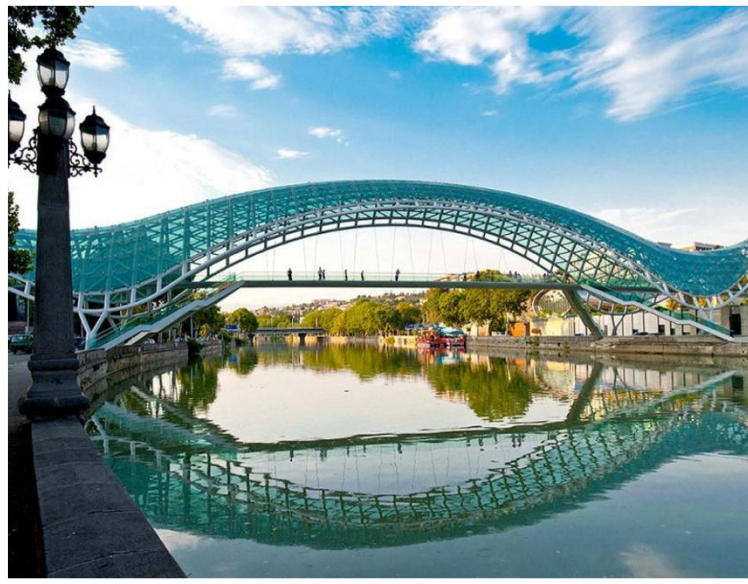
Стеклянный мост Мира.