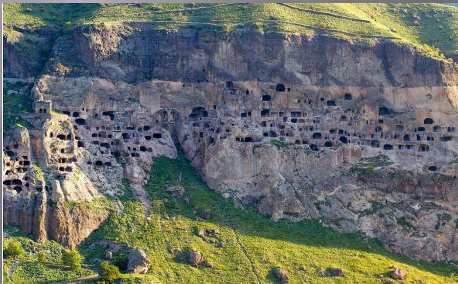
Вардзия- Пещерный город.