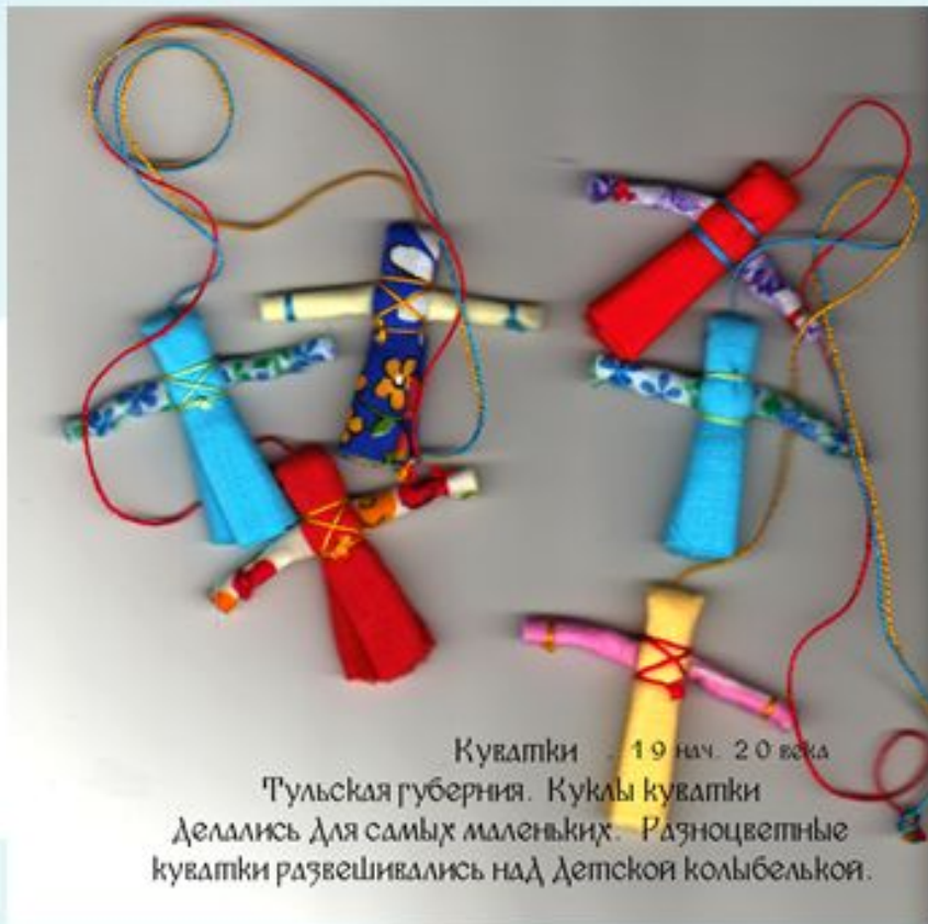
Куватки - 19 нач. 20 века Тульская губерния. Куклы куватки Делались для самых маленьких. Разноцветные куватки развешивались над детской колыбелью.