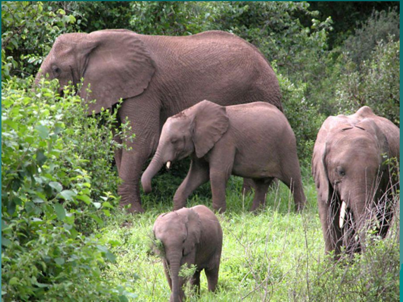
Семья африканских слонов