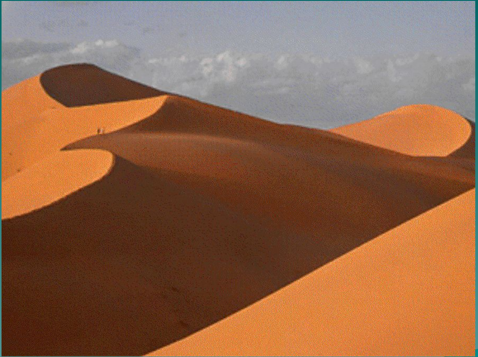
Барханы в пустыне