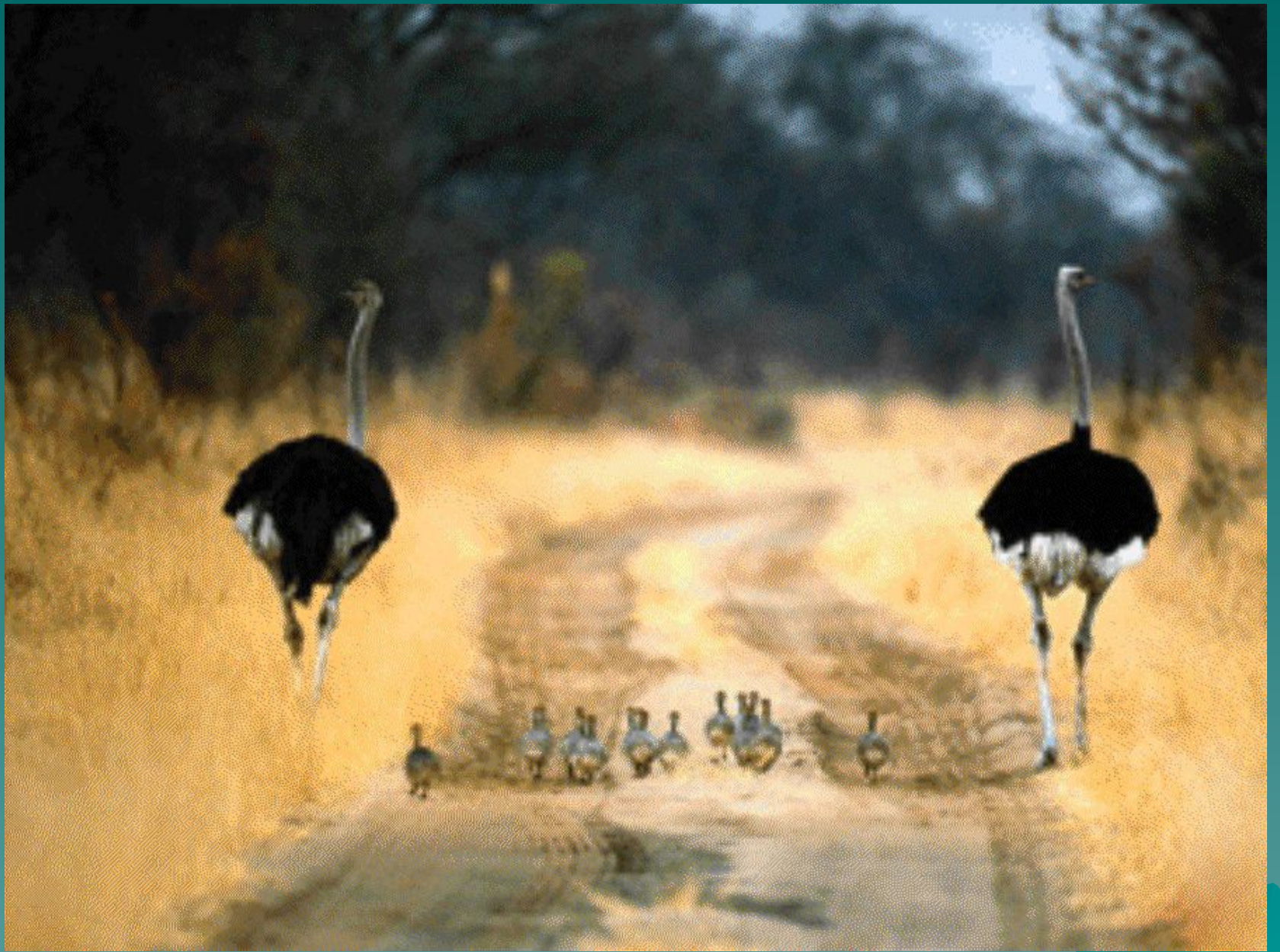
Страусы с выводком