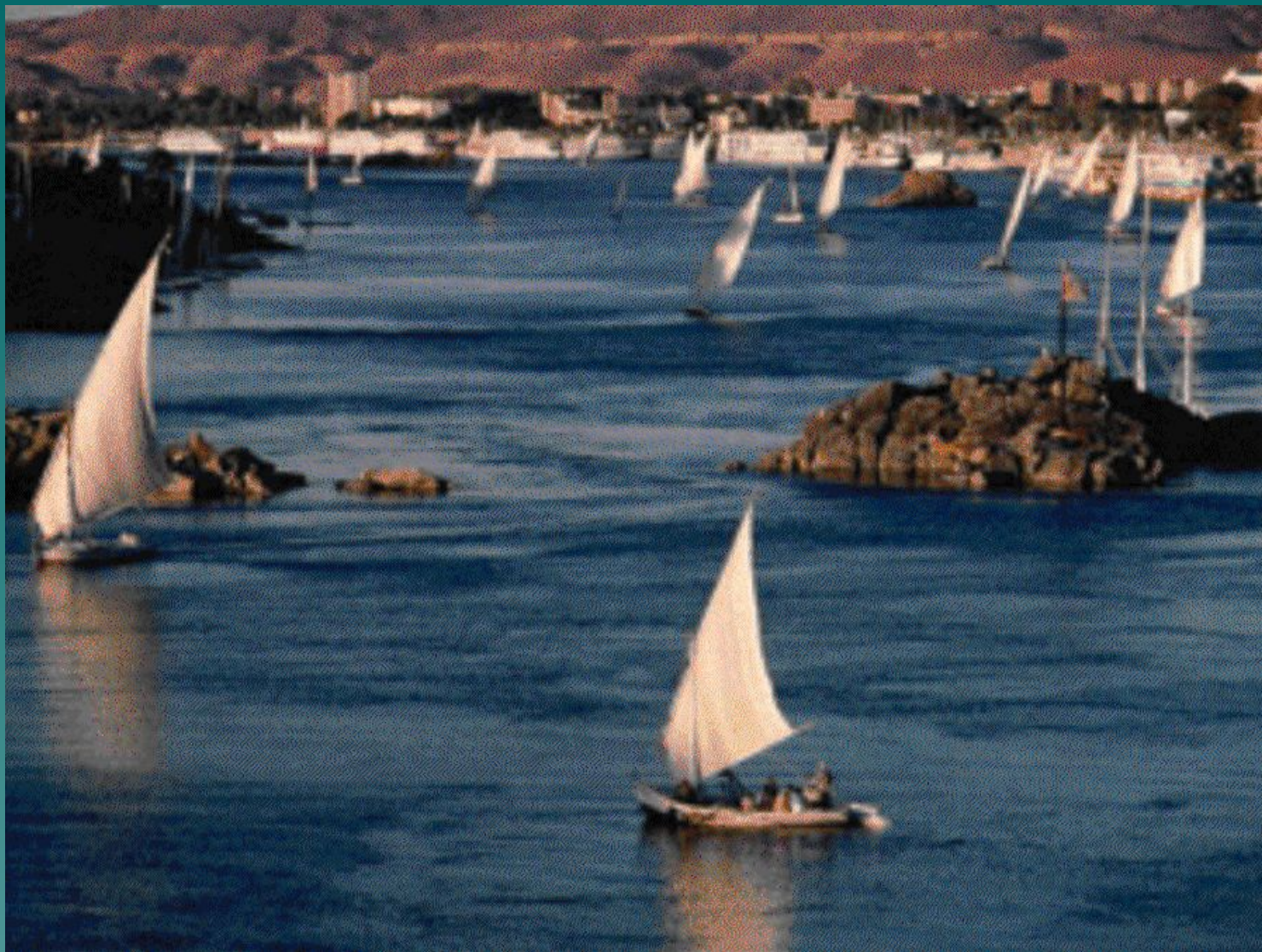
Дельта Нила у города Каира