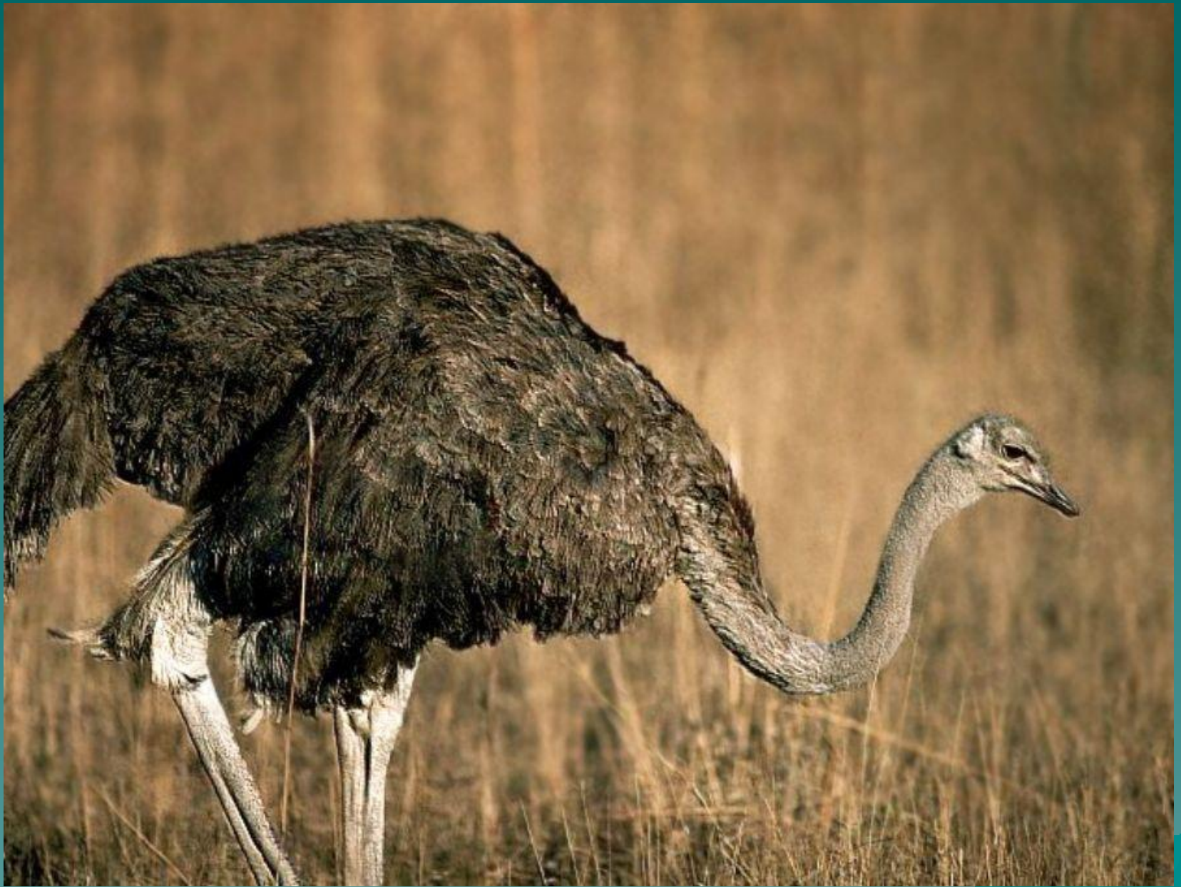
Африканский страус - самая большая птица