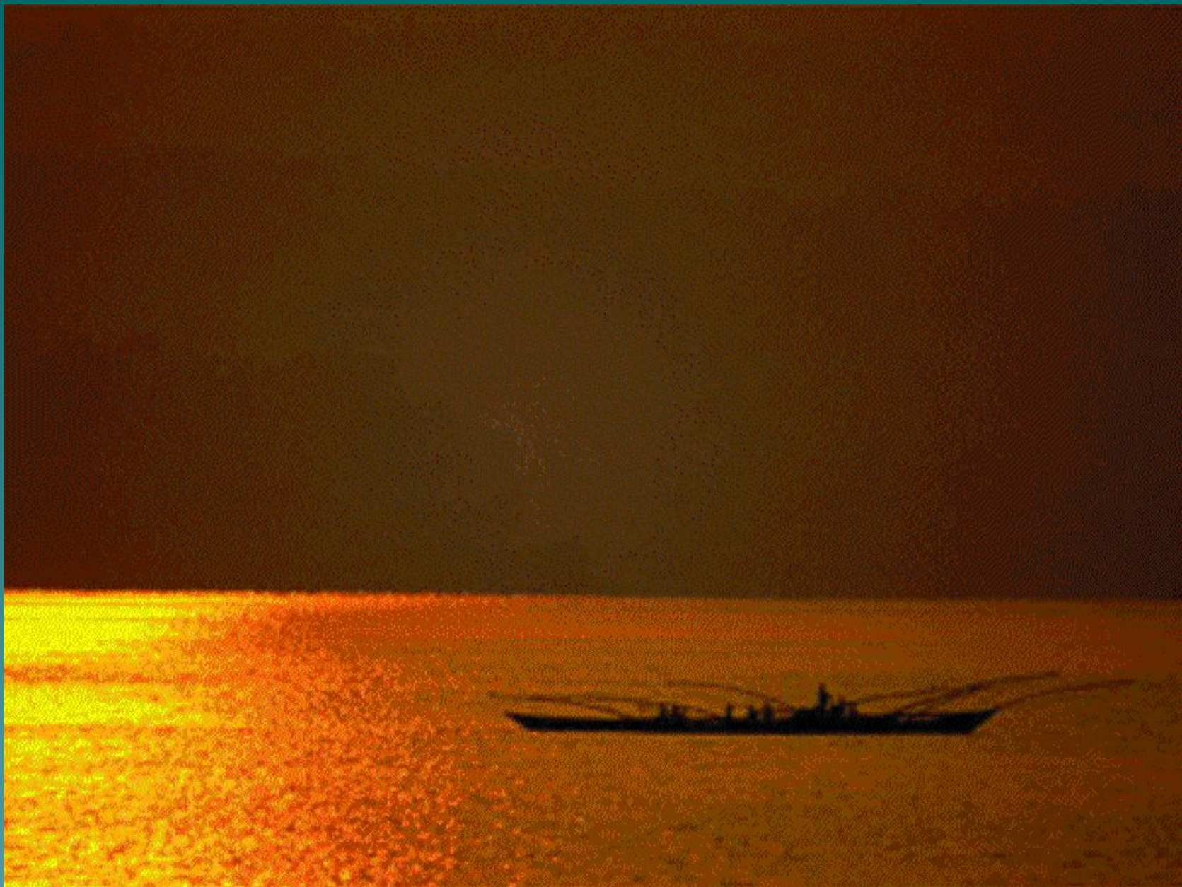
Рыбаки на Ниле