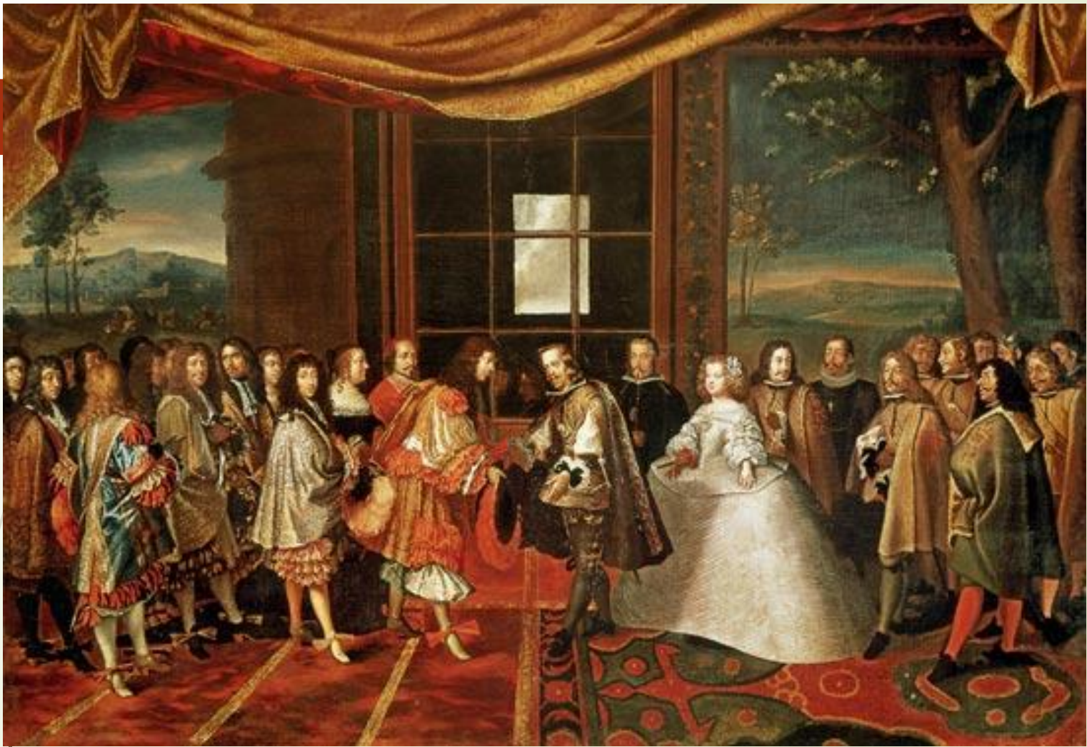
Встреча Людовика XIV с Филиппом IV.

Французские аристократы подражали своему правителю. Модная одежда называлась жюстокором (точно по телу).