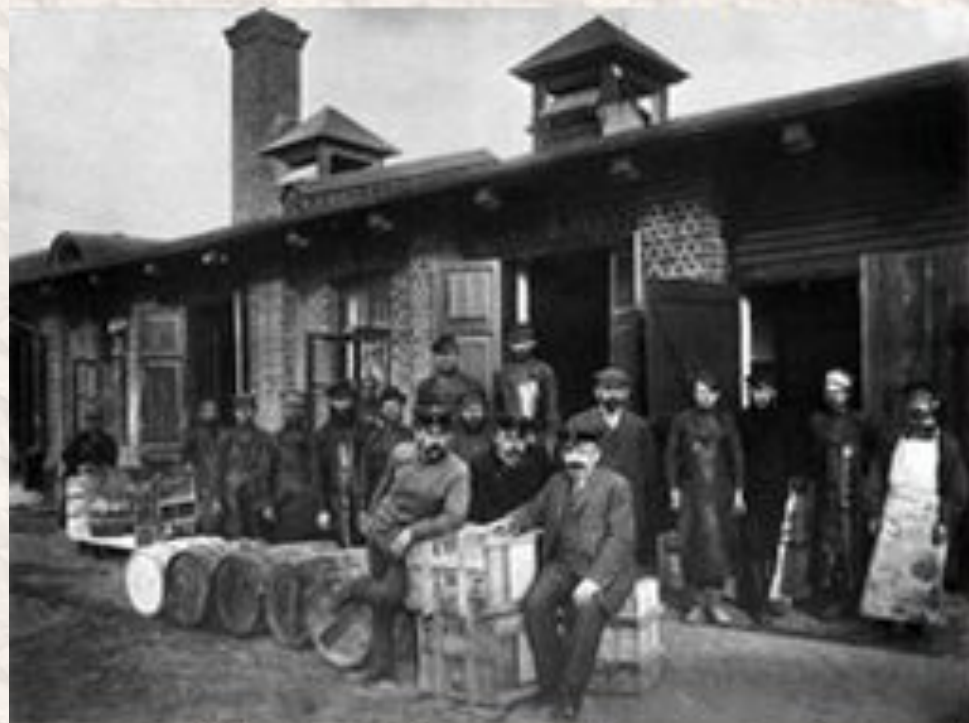
Казенный винный склад. Группа администрации с рабочими. Нижний Новгород. 1890-е гг.

С 1894 г. продажа спирта, водки и крепких вин объявлена монополией государства.