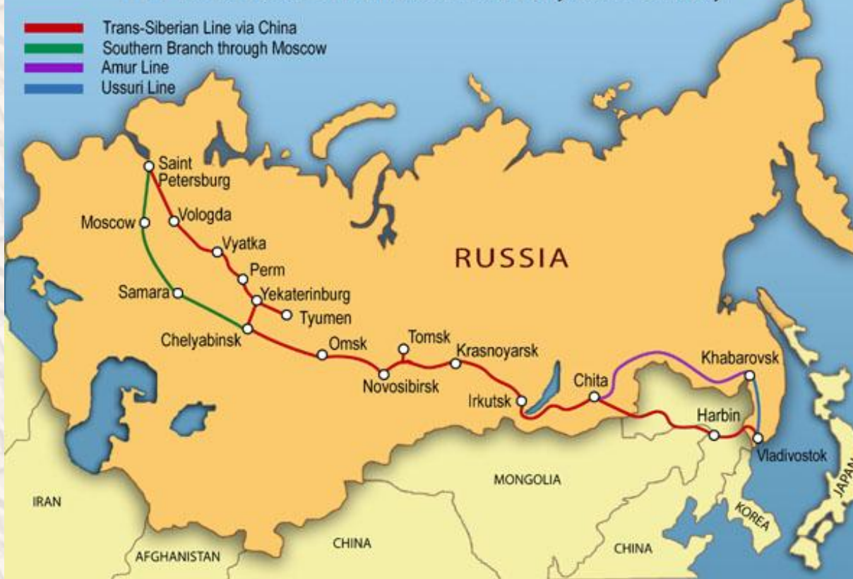
The Trans-Siberian Railroad in the Early 20th Century

В 1896 провёл успешные переговоры с Китаем - согласие Китая на сооружение в Маньчжурии Китайско-Восточной железной дороги (КВЖД)