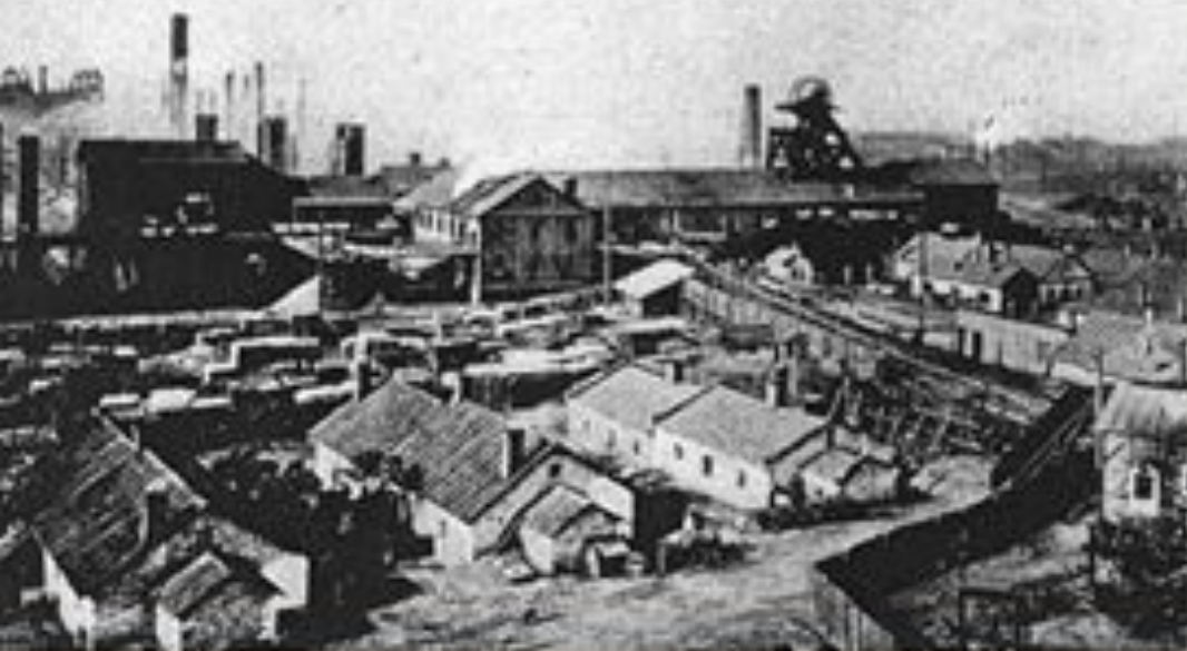
ЮЗОВКА. - Завод Н. Р. Ю на Центральной шахте и коксов. печи.