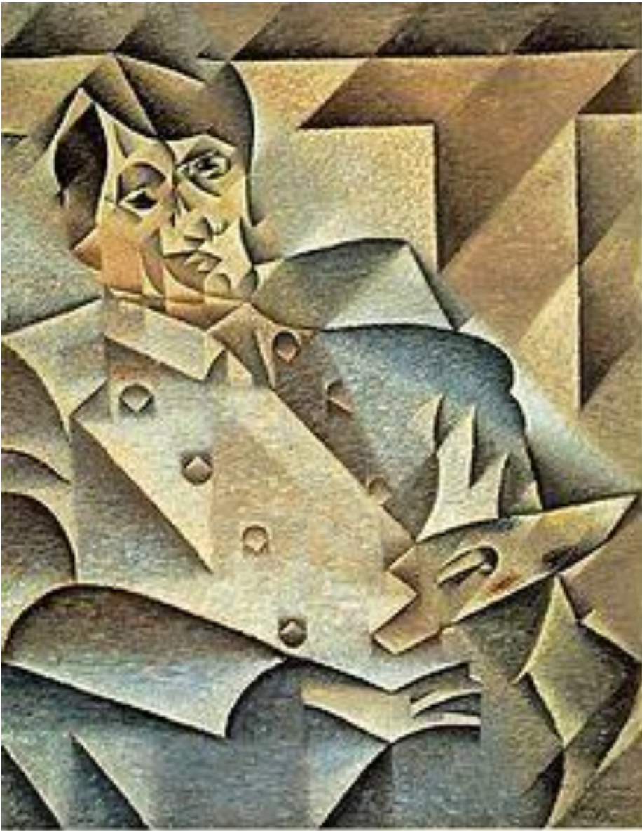
Портрет Пикассо, выполненный Хуаном Грисом (1912г)