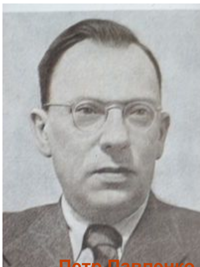
Петр Павленко «На Востоке»