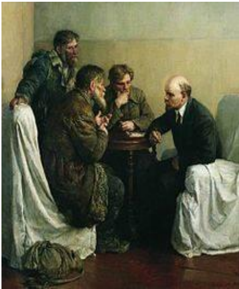
«Ходоки у Ленина» В. Серов