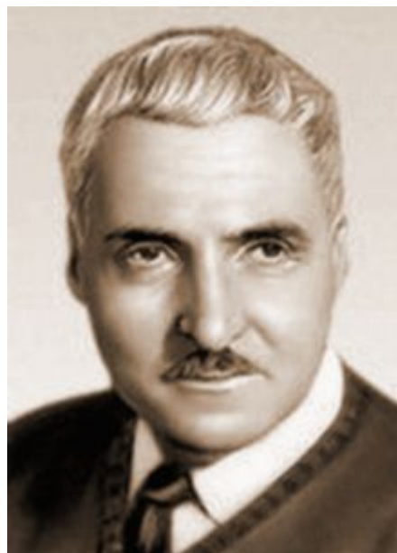
Константин Симонов «Русские люди»