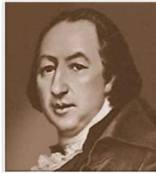
Издатель журналов «Трутенъ» и «Живописецъ»