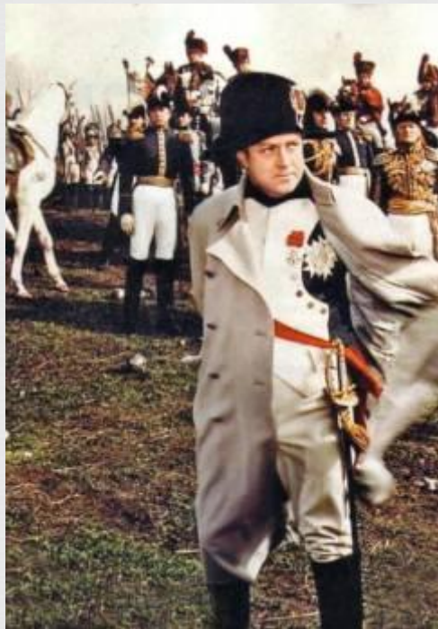
Кадр из фильма С. Бондарчука «Война и мир»

Итак, можно сделать вывод, что Наполеон в романе – художественный образ, а не историческое лицо. Толстой не желает видеть воспетой столькими писателями и поэтами храбрости, величия и гениальности французского полководца, высмеивает его распоряжения и диспозиции. Даже внешний облик Наполеона намеренно искажен. Отрицательные стороны личности героя (эгоизм, грубость, самовлюбленность, жестокость) Толстой рисует более ярко, в то время как значение положительных (полководческий гений) намеренно снижено. Но несмотря на это, поведение и моральную сторону личности французского императора писатель воспроизвел точно.