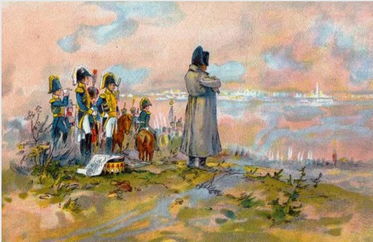
«Наполеон на Поклонной горе» ил. В. Верещагина.

«Прошло два часа. Наполеон позавтракал и опять стоял на том же месте, на поклонной горе, ожидая депутацию. Речь его к боярам уже ясно сложилось в его воображении. Речь эта была исполнена достоинства и того величия, которого понимал Наполеон.»