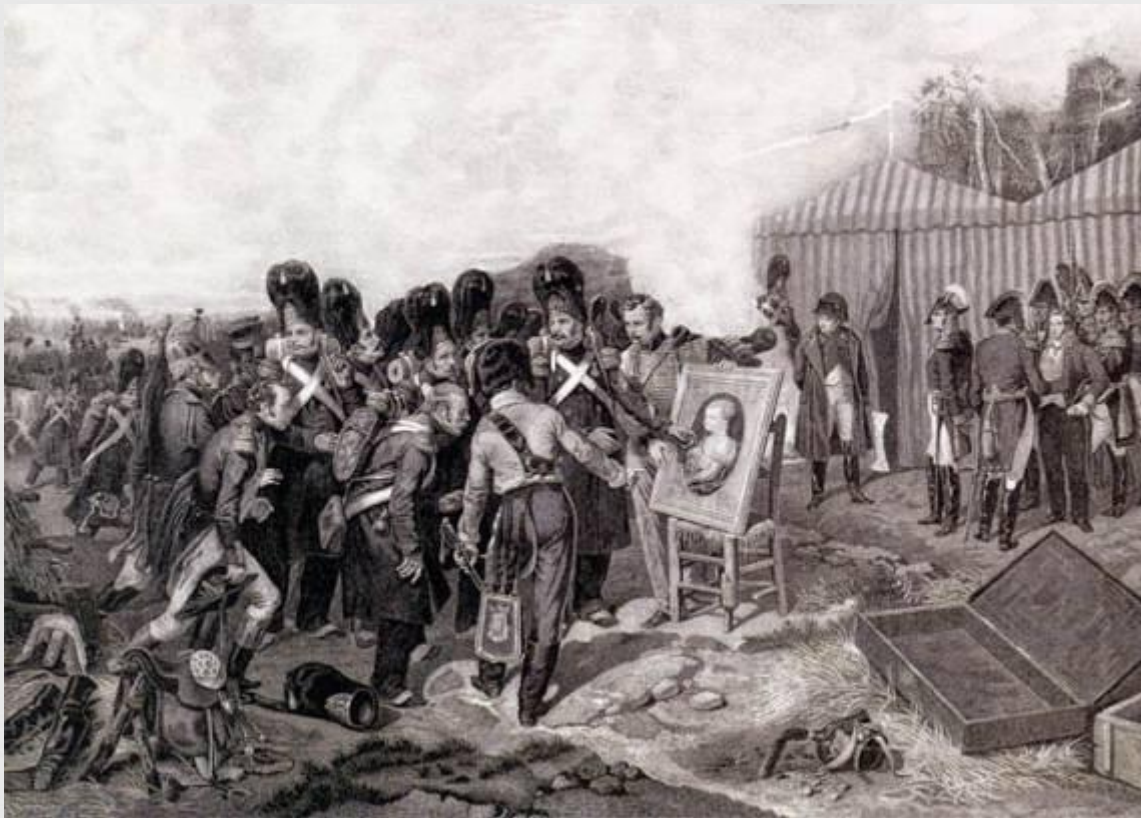
Наполеон показывает гвардии портрет своего сына Х.Делиус по оригиналу Хагнера, середина XIX века Бумага, гравюра

Предоставляю самому себе и его чувству великого человека.»