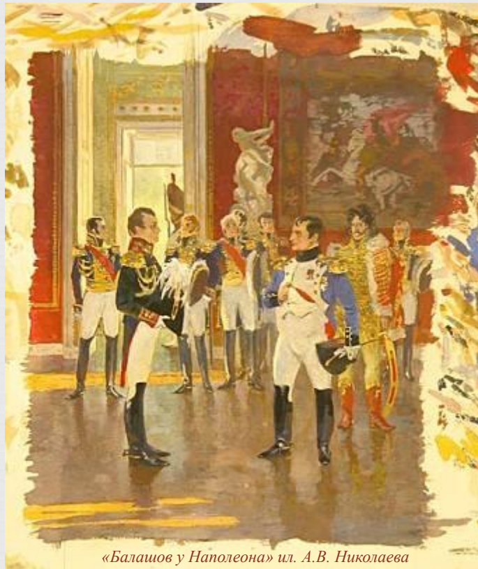
«Балашов у Наполеона» ил. А.В. Николаева

«Быстро отварились обе половинки двери, всё затихло, и из кабинета зазвучали другие, твёрдые, решительные шаги: это был Наполеон. Он был в синем мундире, раскрытым над белым жилетом, спускавшимся на круглый живот, в белых лосинах, обтягивавших жирные ляжки коротких ног, и в ботфортах...Белая пухлая шея его резко выступала из-за чёрного воротника мундира; от него пахло одеколоном...Вся его потолстевшая, короткая фигура с широкими толстыми плечами и невольно выставленным вперёд животом и грудью имела тот представительный, осанистый вид, который всегда имеют живущие в хале сорокалетние люди.»