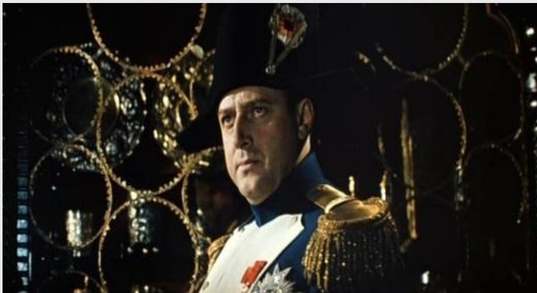
Кадр из фильма С. Бондарчука «Война и мир»

Цель урока: мы должны проследить, где и каким предстает великий французский полководец в романе Л. Н. Толстого.