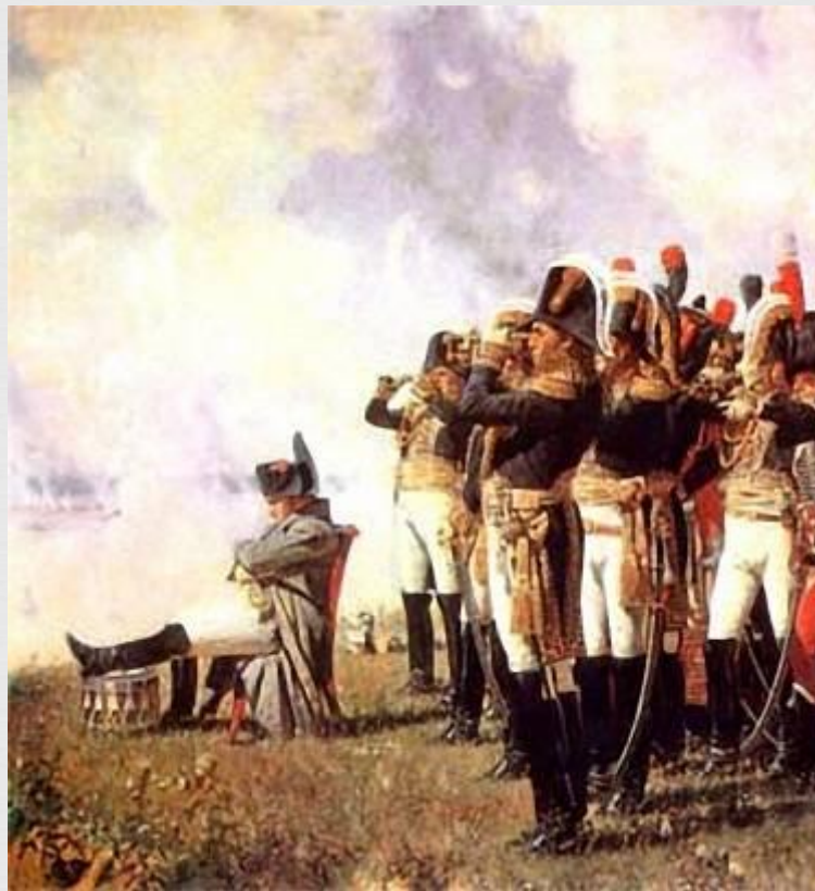
Наполеон на Бородинских высотах. Художник В. Верещагин

« ...он, глядя на этих людей, считал, сколько приходится русских на одного француза, и, обманывая себя, находил причины радоваться, что на одного француза приходилось по пять русских.»