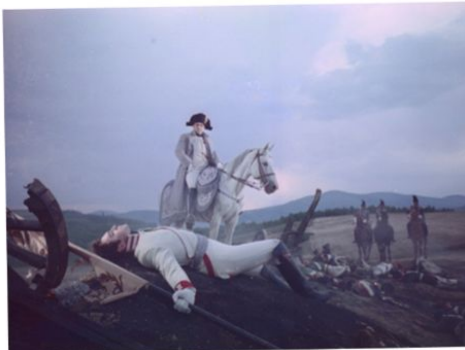
Фильм Роберта Дорнхелма, Брендона Доннисона «Война и мир»

« - Voila une belle mort, - сказал Наполеон, глядя на Болконского.