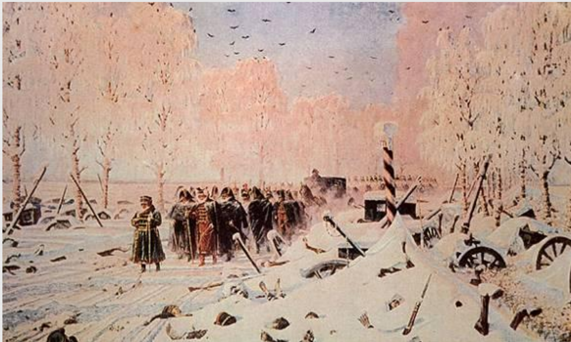
В.В. Верещагин На большой дороге - отступление, бегство...

«Изучать искусные маневры и цели Наполеона и его войска со временем вступления в Москву и до уничтожения этого войска – все равно, что изучать значение предсмертных прыжков и судорог смертельно раненного животного.»