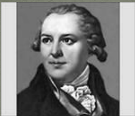
Шубин Федор Иванович (1740 – 1805)