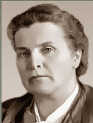
Вера Игнатьевна Мухина (1889 – 1953)