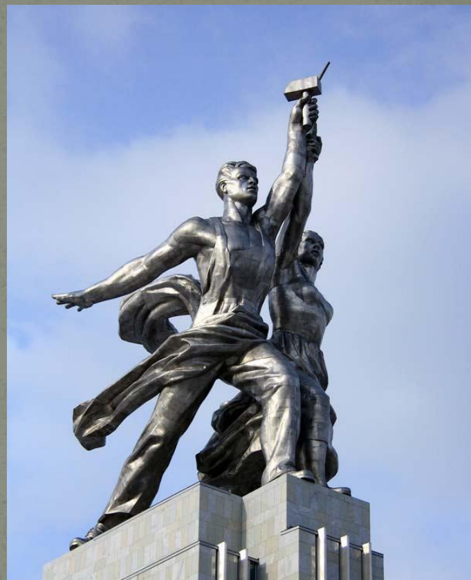
Мухина В.И. Рабочий и колхозница.