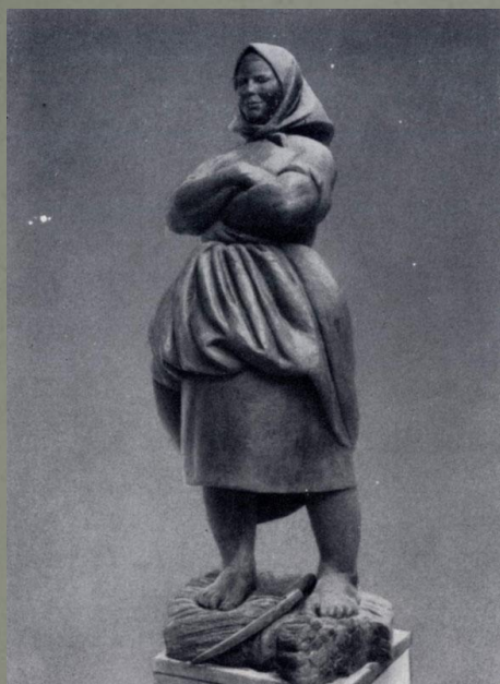
В. И. Мухина. Крестьянка. Бронза.