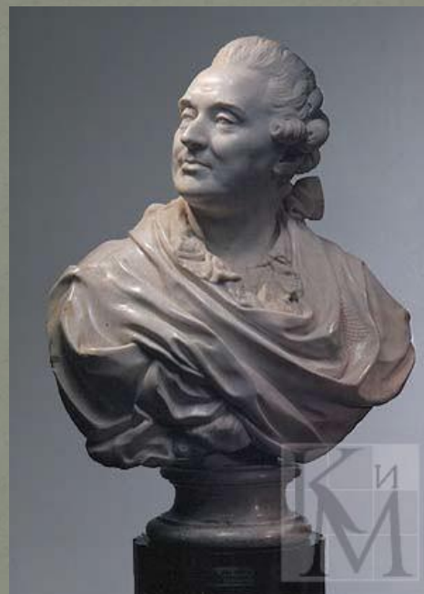
ШУБИН Федот Иванович Бюст А. М. Голицына