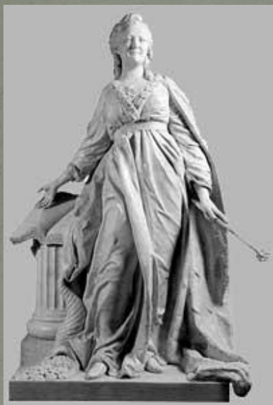
Мраморная скульптура Екатерины II работы Ф.И. Шубина