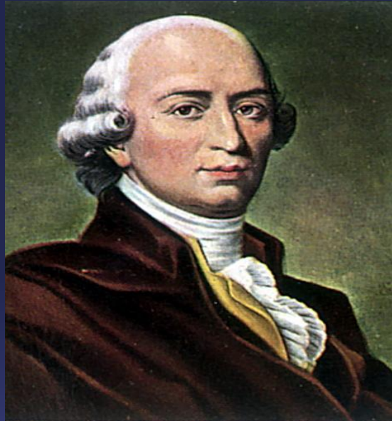
Иоганн Готфрид Гердер

Термин «политическая культура» ввел в научный оборот И. Гердер. В политическую науку он был введен американским политологом Г. Алмондом. Классическое определение было сформулировано Г. Алмондом и Дж. Пауэллом. Развернутое исследование политической культуры как системы ценностных ориентаций и политических действий началось с 1950-х годов.