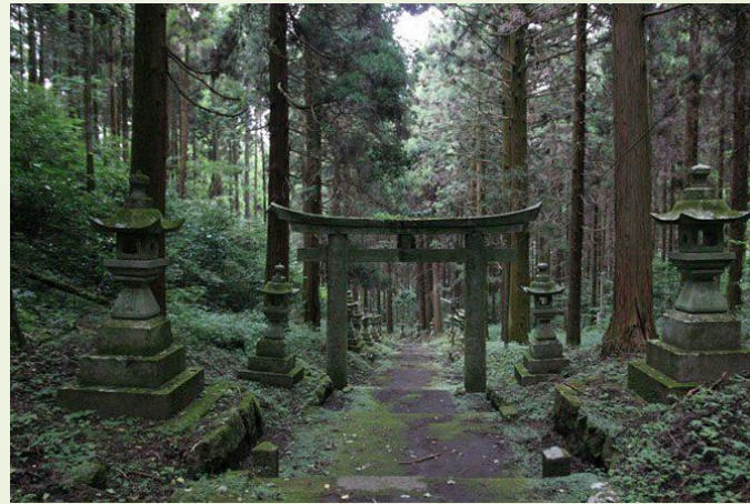
Японский священный лес