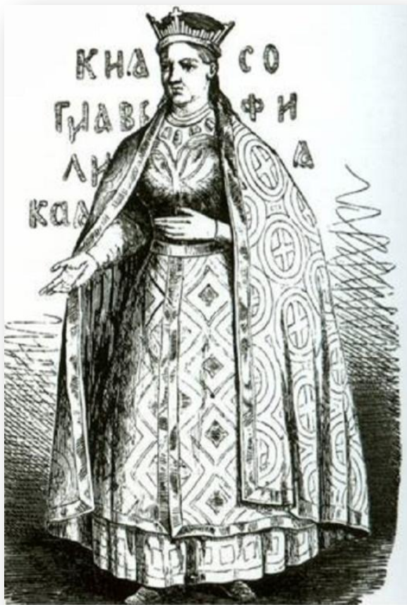
Дачка князя Вітаўта Соф'я. Малюнак 19 ст. з вышыўкі 15 ст.

История эта весьма богата: Княгиня Софья здесь жила когда-то. Здесьние места она всем сердцем полюбила, Красотою природа княгиню пленила.