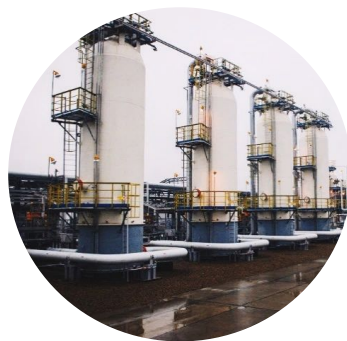
Газопереработка и химия