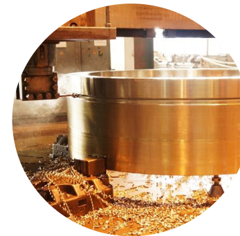
Горно-рудная промышленность и металлургия