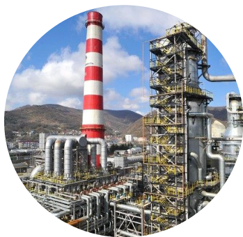
Нефтепереработка и нефтехимия