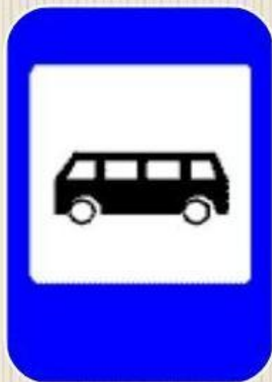
Место остановки автобуса

На таких остановках имеются информационно-указательные знаки .