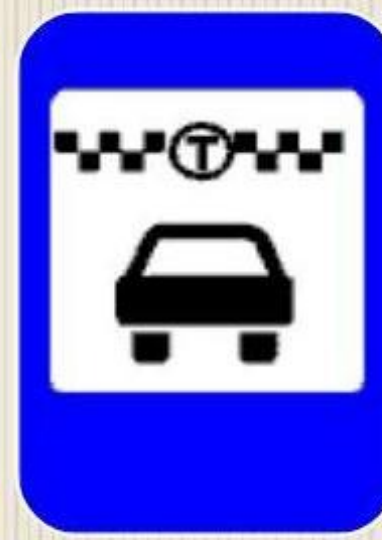
Место остановки такси