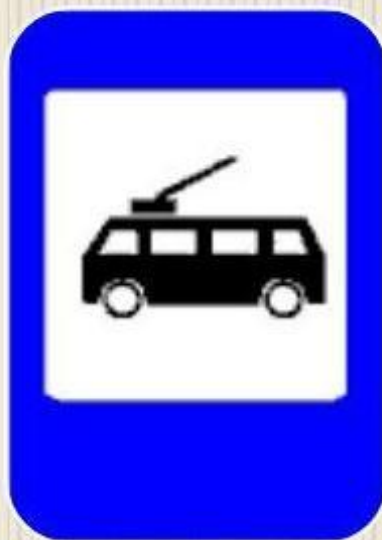
Место остановки троллейбуса