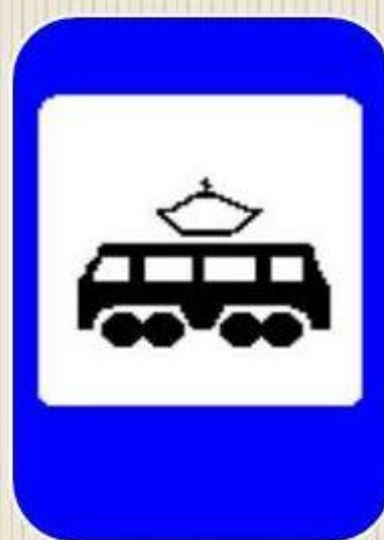
Место остановки трамвая