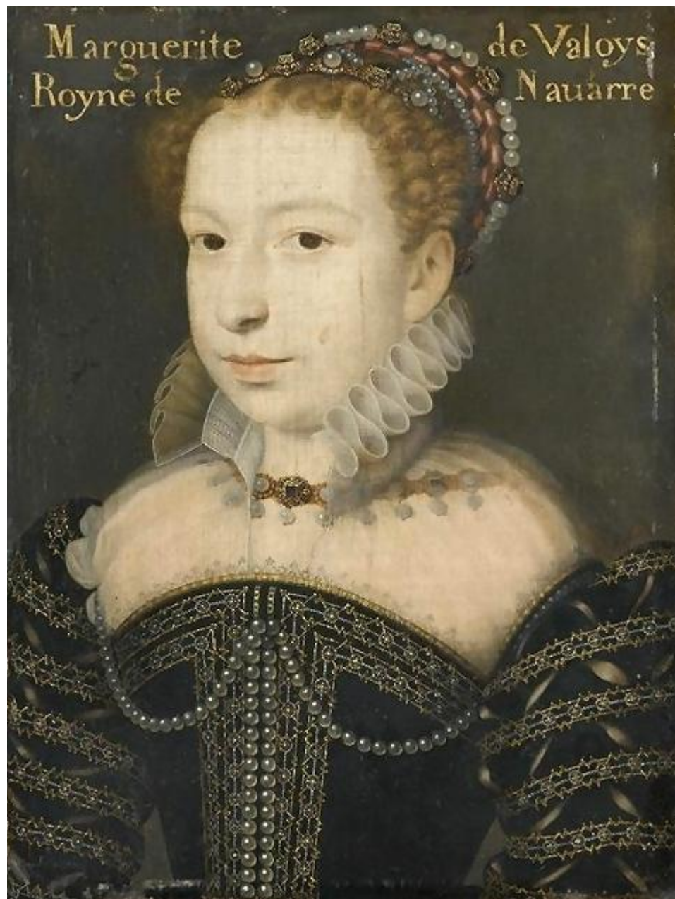
Франсуа Клуэ. Портрет Маргариты Валуа