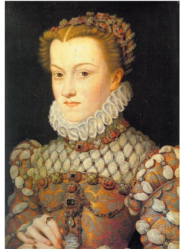
Портрет Елизаветы Австрийской Франсуа Клуэ 1572, Лувр, Париж