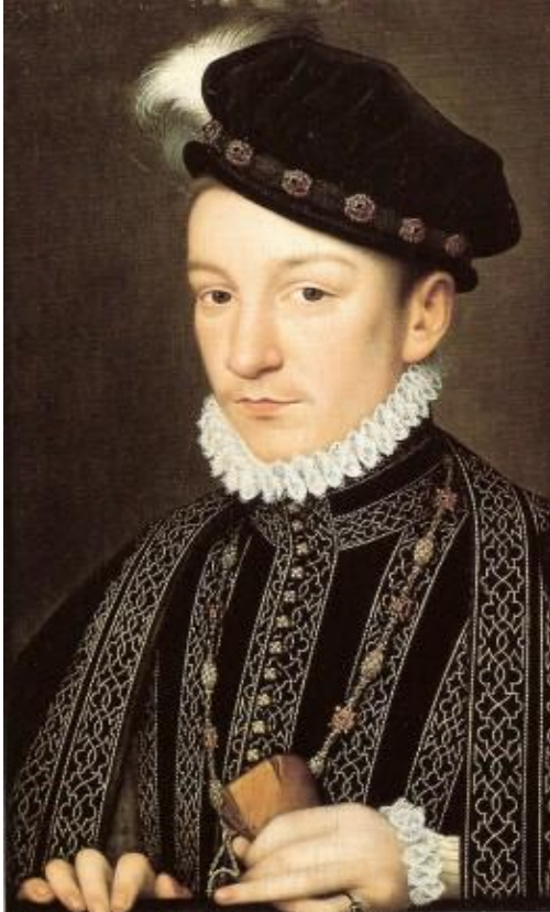
Карл IX, портрет Франсуа Клуэ Музей истории искусств, Вена