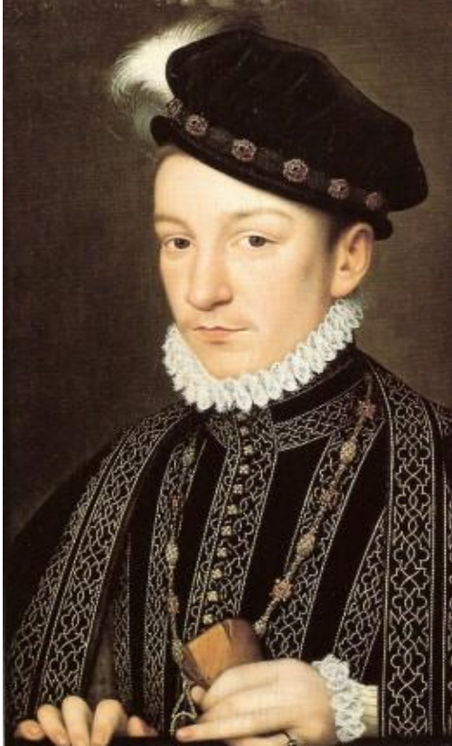
Карл IX, портрет Франсуа Клуэ Музей истории искусств, Вена