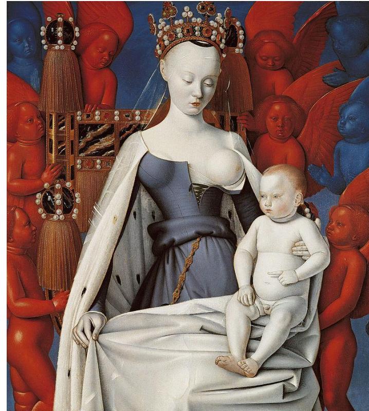
Богоматерь с младенцем. ок. 1450