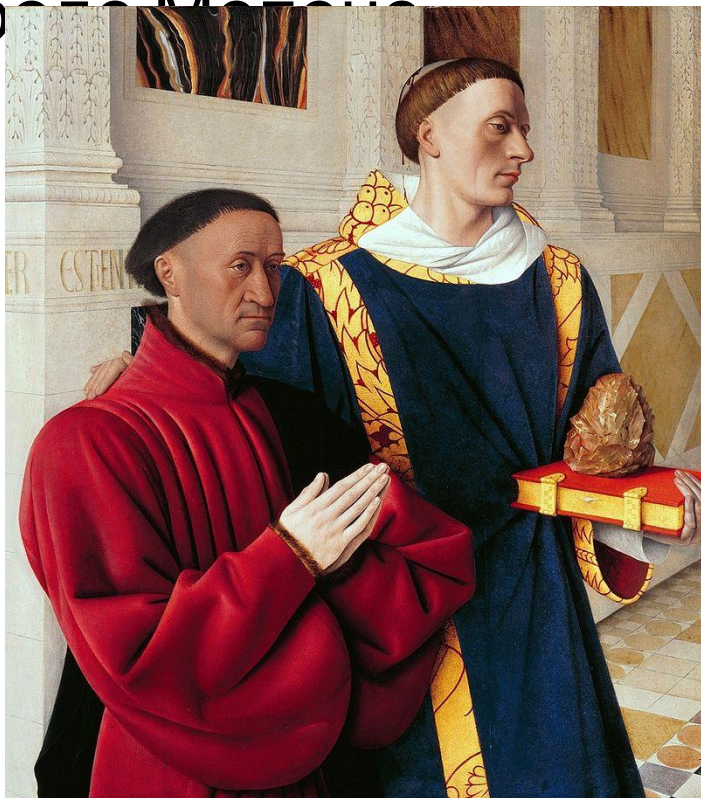
Этьен Шевалье и святой Стефан. ок. 1450

Произведения К значительным произведениям художника можно отнести «Меленский диптих» (ок.1451-1456), заказанный Фуке Этьеном Шевалье для церкви в его родном городе Мелёне.