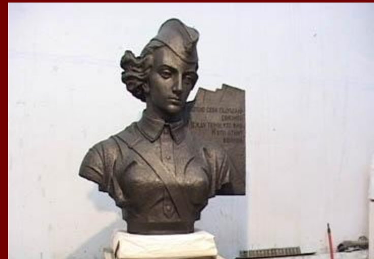
Памятник Ю. Друниной в Ялutorовске

Юлия Друнина Стихи о Великой Отечественной войне