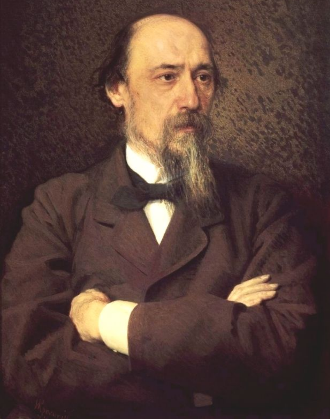
Никола́й Алексе́евич Некрасо́в 1821 — 1878, русский поэт, писатель и публицист