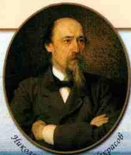
Николай Алексеевич Некрасов