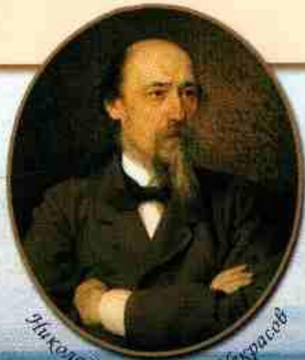
Николай Алексеевич Некрасов