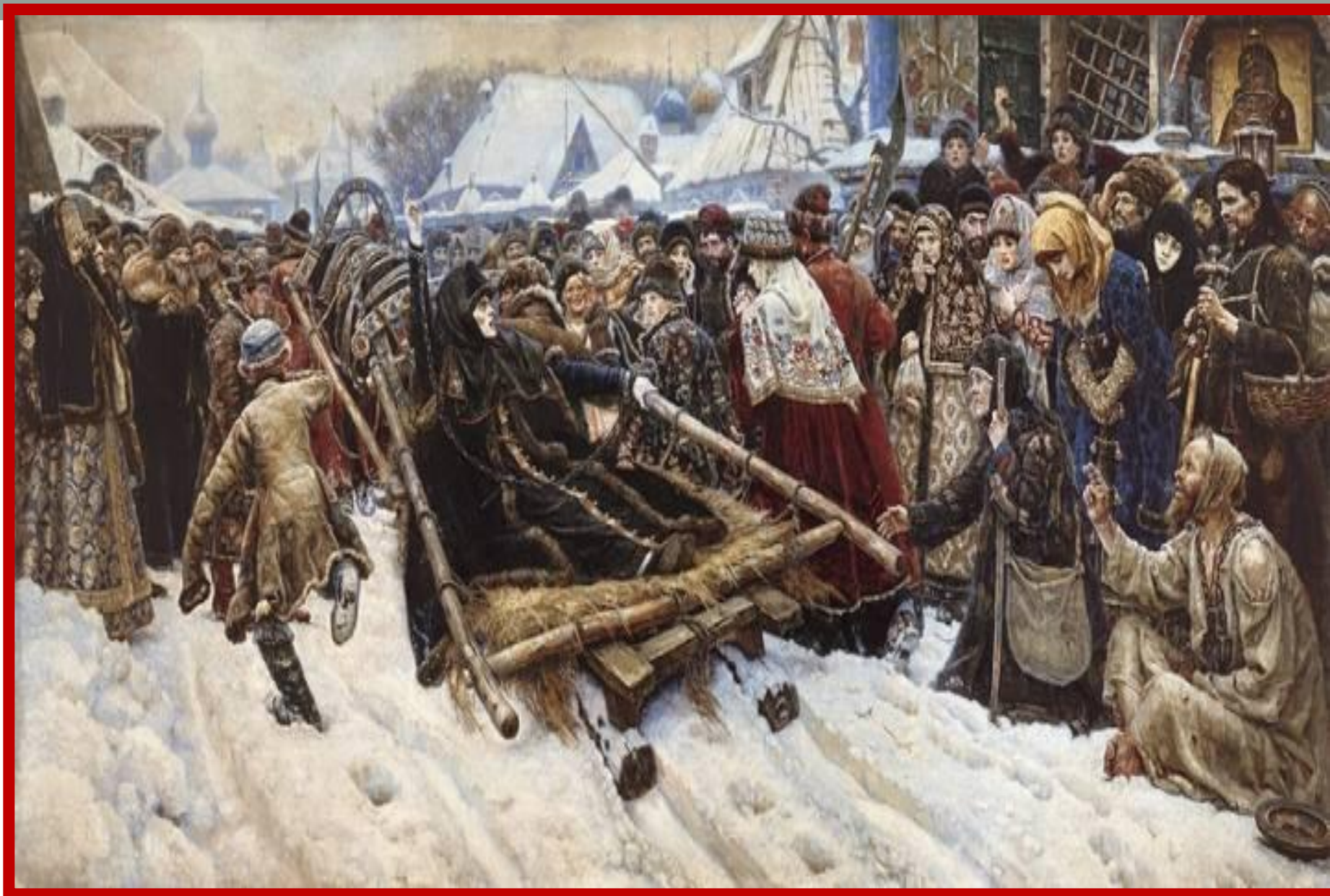
Суриков В.И. Боярыня Морозова.