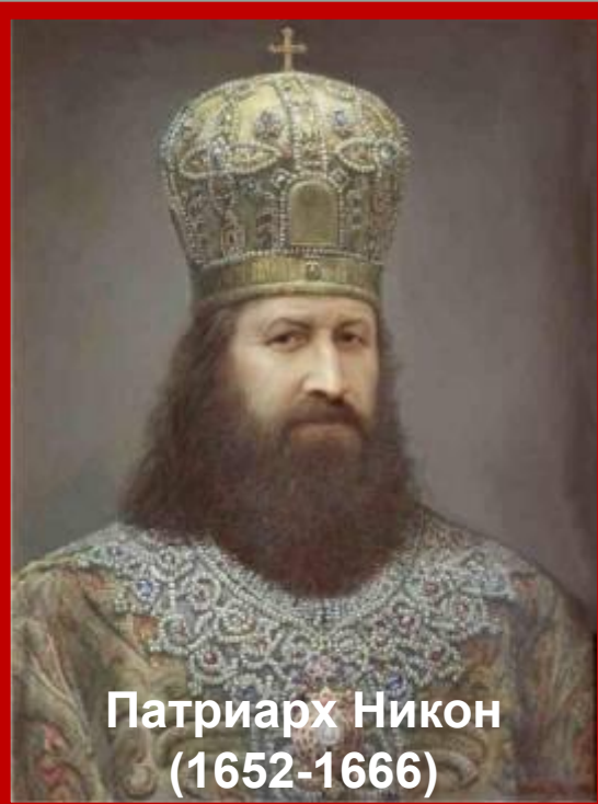
Патриарх Никон (1652-1666)

1652 г. – избрание Никона новым патрирхом России