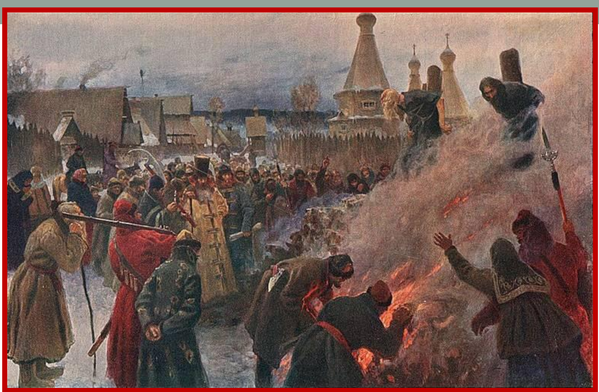
Григорий Мясоедов. "Сожжение протопопа Аввакума".