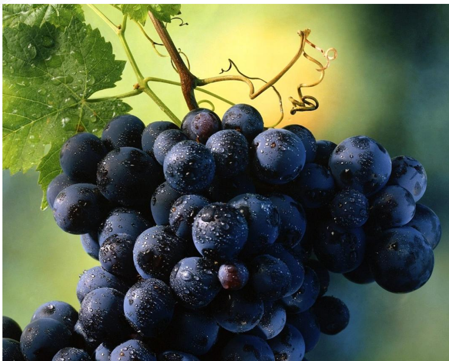
Сорт винограда марс

Вся система соцветий включает в себе ножки, развившиеся от узлов стеблей, и разветвлений разнообразной формы, на конце которых вызревают бутоны цветков. Бутоны образуют группы, в каждой группе по три бутона. Два боковых бутона инфантильные по отношению к среднему он сформирован сильнее, чем остальные.