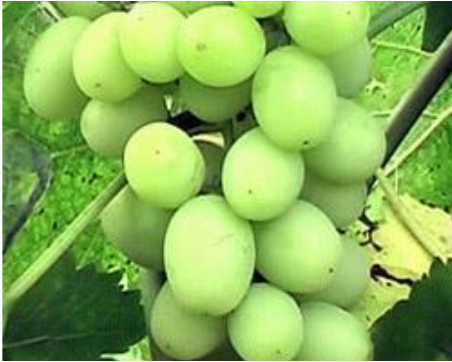
Сорт винограда агрус

СТОЛОВЫЙ СОРТ ВИНОГРАДА, ОЧЕНЬ РАННЕГО СРОКА СОЗРЕВАНИЯ, ОТ НАЧАЛА РАСПУСКАНИЯ ПОЧЕК И ДО ПОЛНОЙ ЗРЕЛОСТИ ЯГОД ПРОХОДИТ 100-115 ДНЕЙ. НА ЮГЕ БЕЛАРУСИ СОЗРЕВАЕТ В СЕРЕДИНЕ АВГУСТА. КУСТЫ ВИНОГРАДНОГО РАСТЕНИЯ СРЕДНЕРОСЛЫЕ. ПЛОДНОСТЬ ПОБЕГОВ ВИНОГРАДА ОЧЕНЬ ВЫСОКАЯ, СОРТ СКЛОНЕН К ПЕРЕГРУЗКЕ УРОЖАЕМ, ПОЭТОМУ НЕОБХОДИМО НОРМИРОВАНИЕ РАСТЕНИЙ ГРОЗДЯМИ. СОРТ ВИНОГРАДНОЙ ЛОЗЫ УРОЖАЙНЫЙ, ПОБЕГИ ВЫЗРЕВАЮТ ХОРОШО, УКОРЕНЯЕМОСТЬ ЧЕРЕНКОВ УДОВЛЕТВОРИТЕЛЬНАЯ. ЦВЕТК ФУНКЦИОНАЛЬНО ЖЕНСКИЙ, НО ОПЫЛЯЕМОСТЬ ХОРОШАЯ