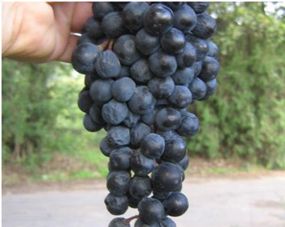
Сорт винограда тавроси

ТАВРОСИ – ВИННЫЙ СОРТ ВИНОГРАДА. СОЗРЕВАЕТ В НАЧАЛЕ СЕНТЯБРЯ. ЛИСТ СРЕДНИЙ, ОКРУГЛЫЙ, ПЯТИЛОПАСТНЫЙ, С ХОРОШО ВЫРАЖЕННЫМИ ВТОРИЧНЫМИ ЛОПАСТЯМИ, СИЛЬНО РАССЕЧЕННЫЙ, НА НИЖНЕЙ СТОРОНЕ ЛИСТА ОПУШЕНИЕ ПАУТИНИСТОЕ. ЧЕРЕШКОВАЯ ВЫЕМКА ОТКРЫТАЯ, ЛИРОВИДНАЯ С ПОЧТИ ПАРАЛЛЕЛЬНЫМИ СТОРОНАМИ И ОСТРЫМ ДНОМ, РЕЖЕ ЗАКРЫТАЯ С УЗКОЭЛЛИПТИЧЕСКИМ ПРОСВЕТОМ. ЦВЕТОК ОБОЕПОЛЫЙ. ГРОЗДЬ СРЕДНЯЯ, КОНИЧЕСКАЯ, СРЕДНЕПЛОТНАЯ. ЯГОДА СРЕДНЯЯ, ОКРУГЛАЯ, ЧЕРНАЯ, С СИЛЬНЫМ ВОСКОВЫМ НАЛОТОМ. КОЖИЦА ТОЛСТАЯ. МЯКОТЬ СОЧНАЯ, ОКРАШЕННАЯ. ВКУС ПРИЯТНЫЙ. СИЛА РОСТА КУСТОВ БОЛЬШАЯ.