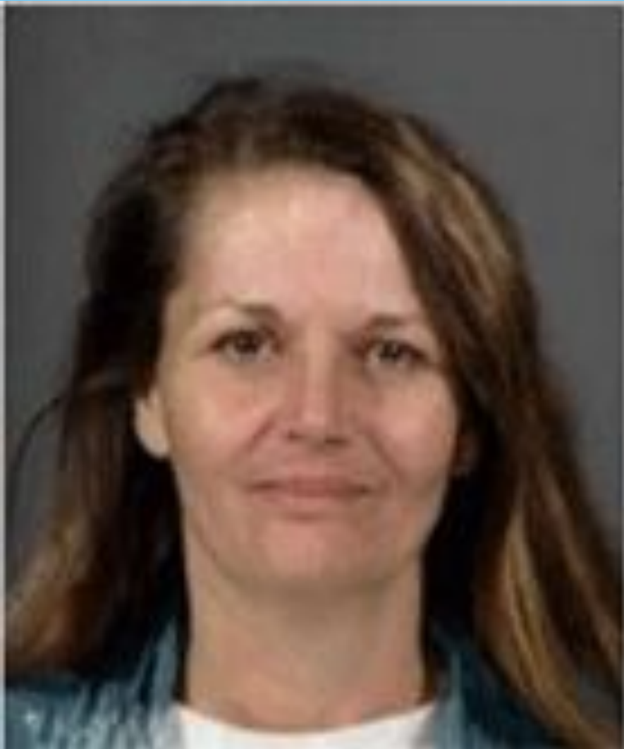
До приема наркотиков