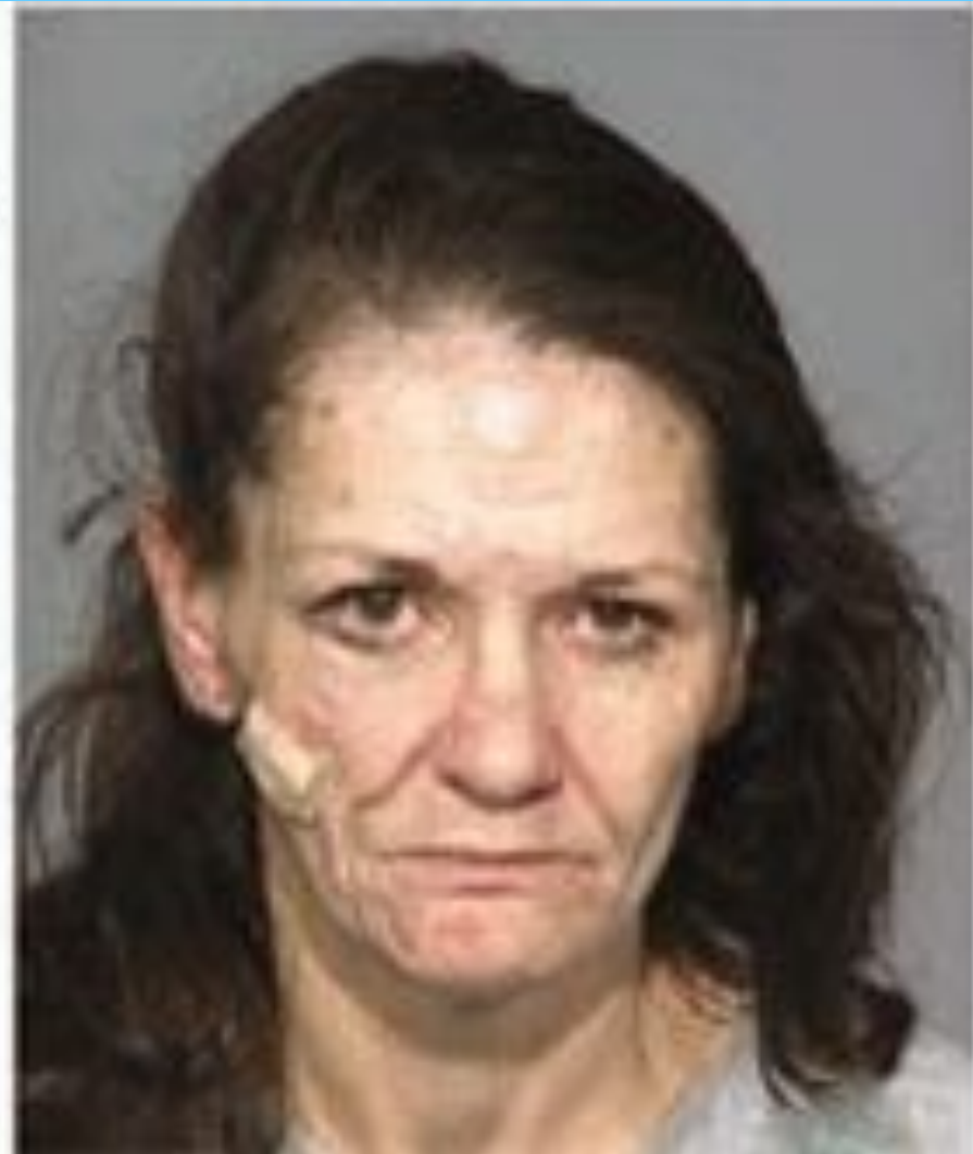
Через 3 года и 5 месяцев