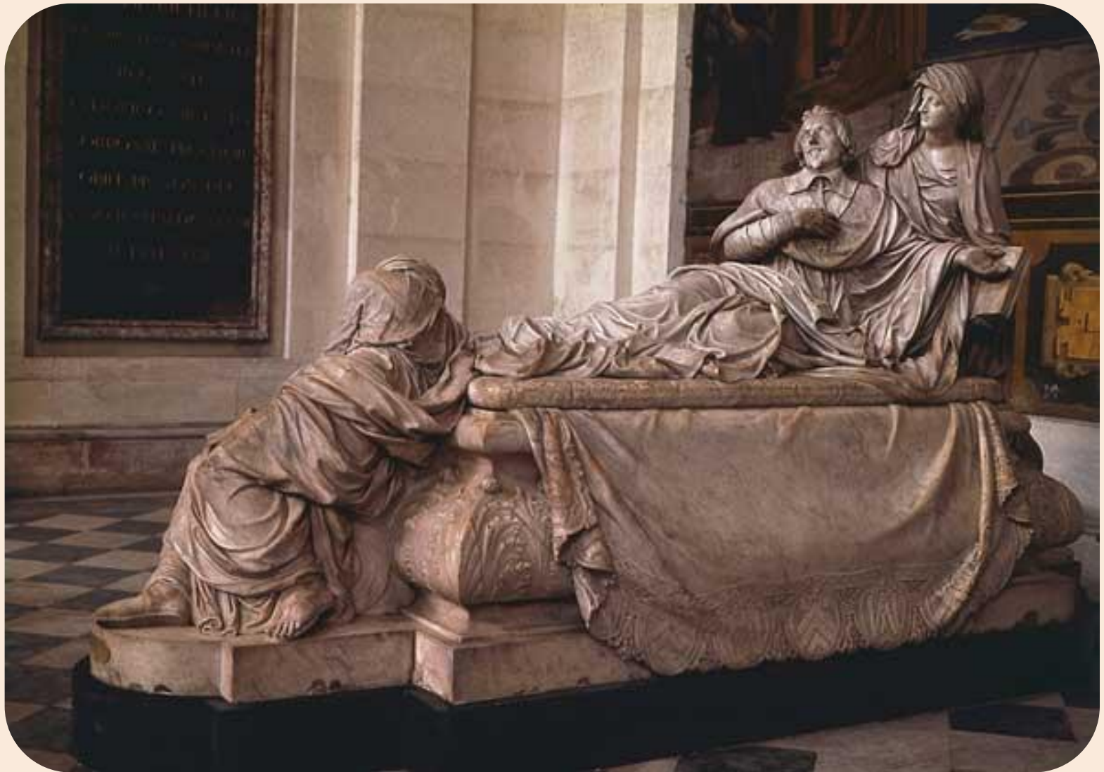
Франсуа Жирардон. Надгробие кардинала Ришелье (1675-1677).