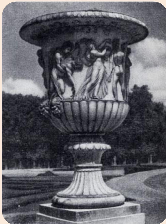
Антуан Кузевокс. Ваза Войны в парке Версаля.