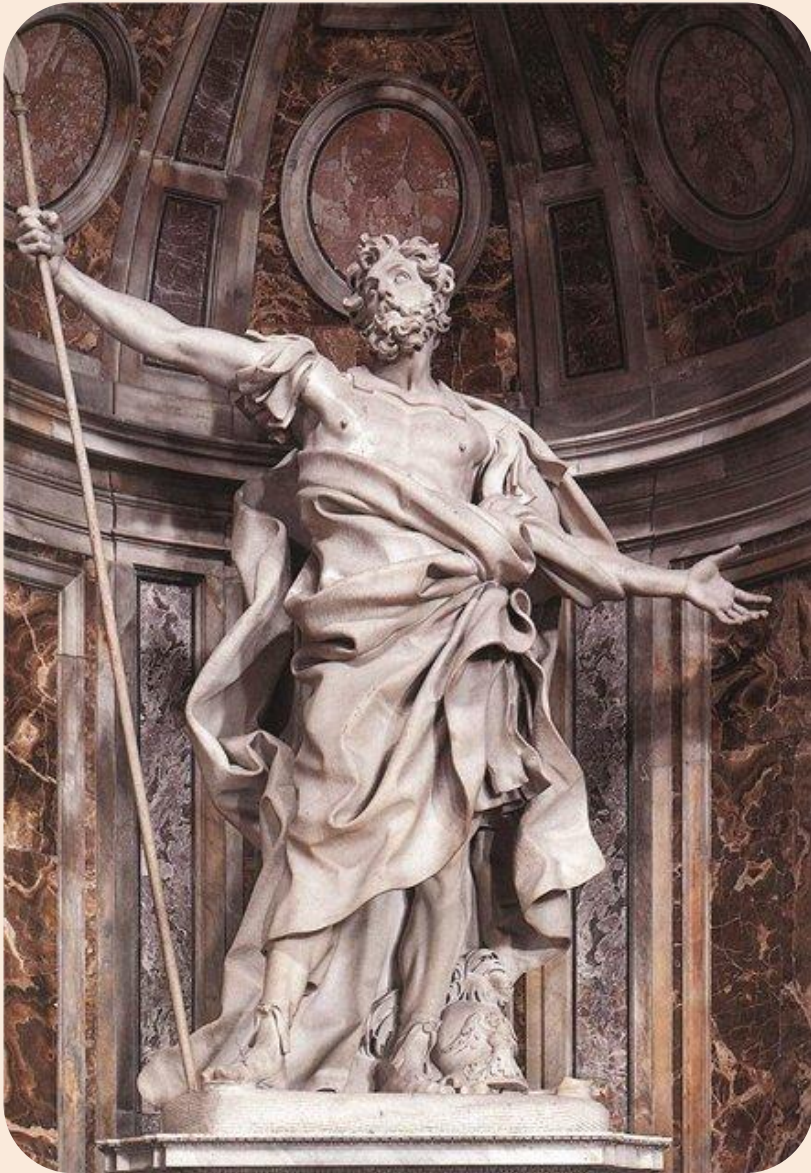
«Святой Лонгин» (1629—1638) в соборе Святого Петра