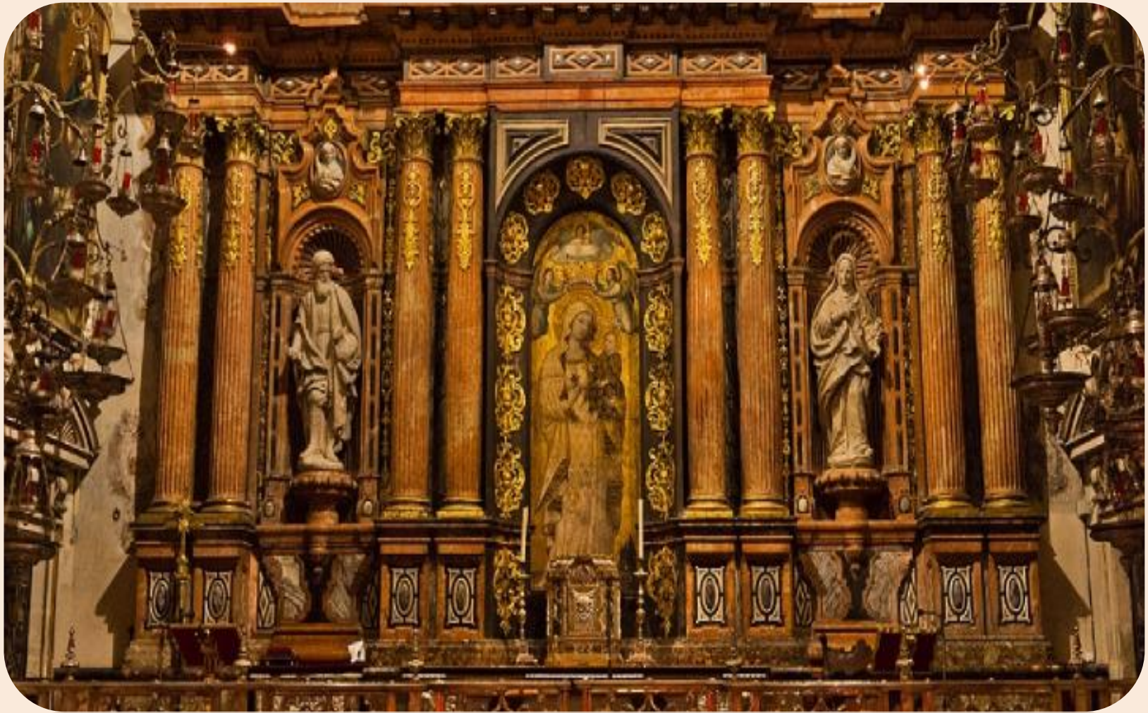
Педро Рольдано. оформление алтаря в соборе Севильи (1670—1672). Севилье