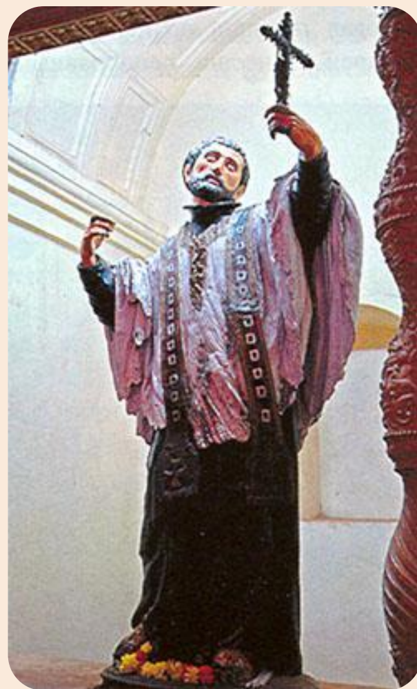
Мартинес Монтаньес. Св. Франциск Ксавьер (1619). Севилье.