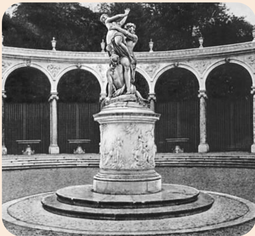
Франсуа Жирардон. Круглая колоннада. Версальский дворец.