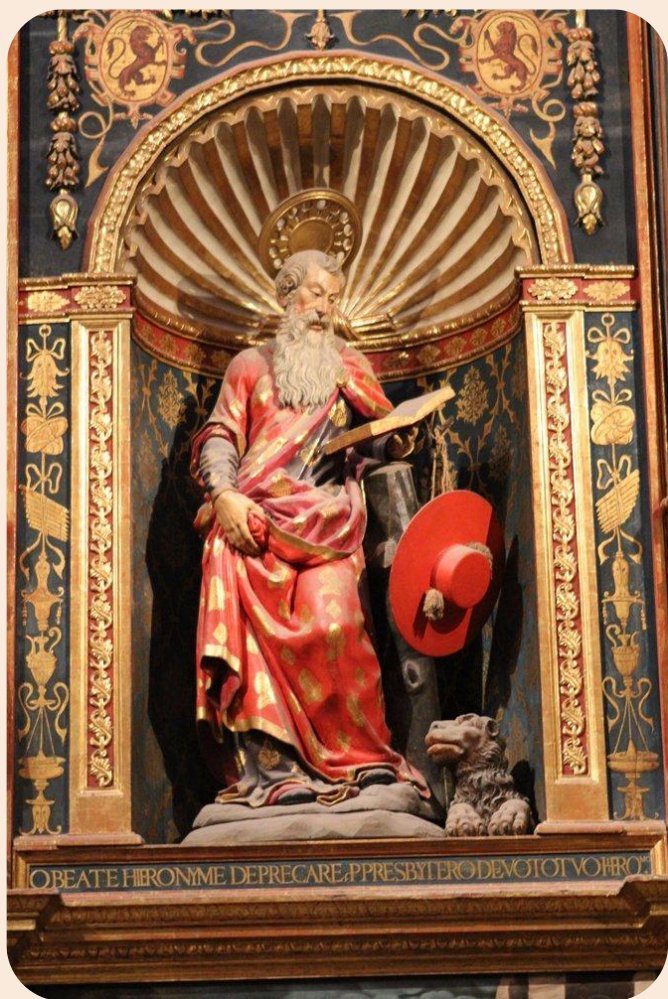
Мартинес Монтаньес. Св. Иероним (1600). Севилье.