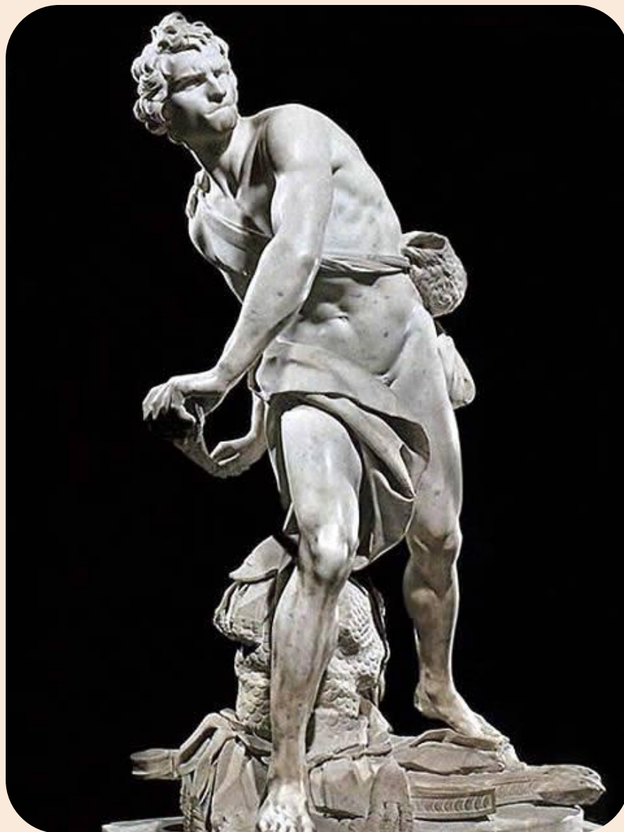
Лоренцо Бернини. Давид