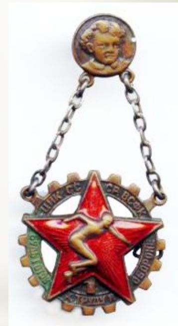
Знак БГТО образца 1934 года