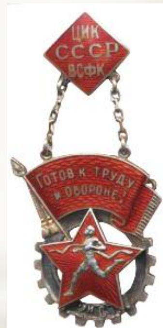
Знак ГТО 1931-1936 годов (2 степень)