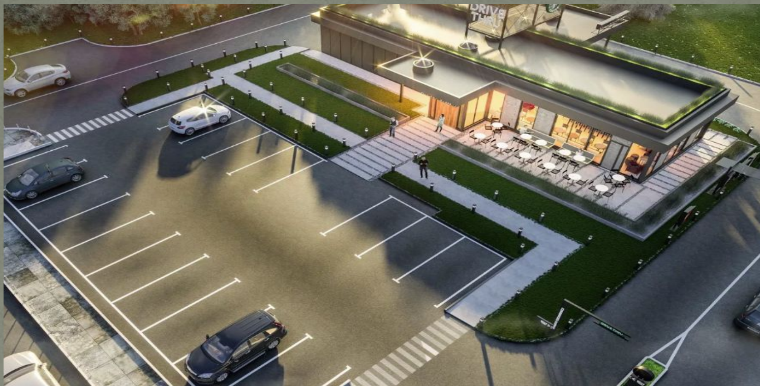
Проект придорожного отеля «Кипарис» в г. Краснодар