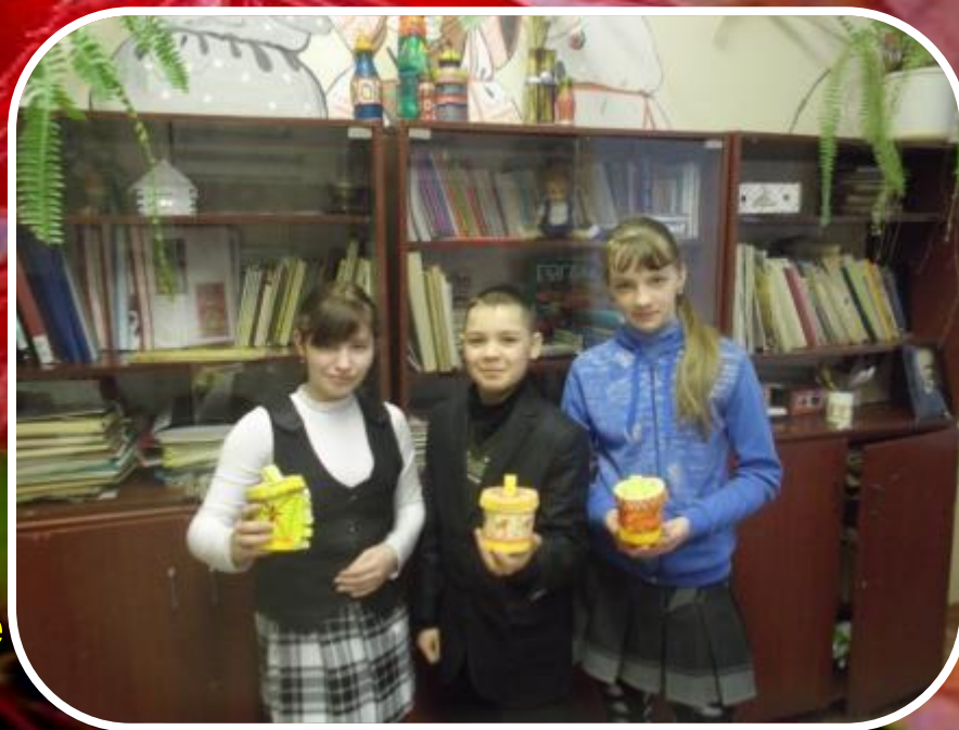
Дети кружка со своими работами (роспись тарелочек из папье- маше, туесок из бумаги, моделирование архитектурных форм)