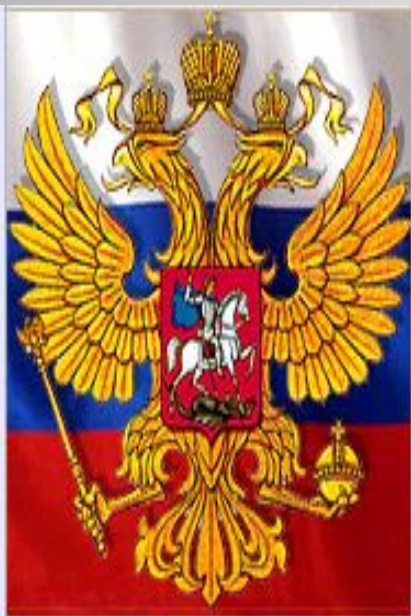
Конституция Российской Федерации.