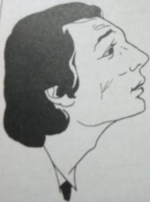
Рис. Юрия Сорокина