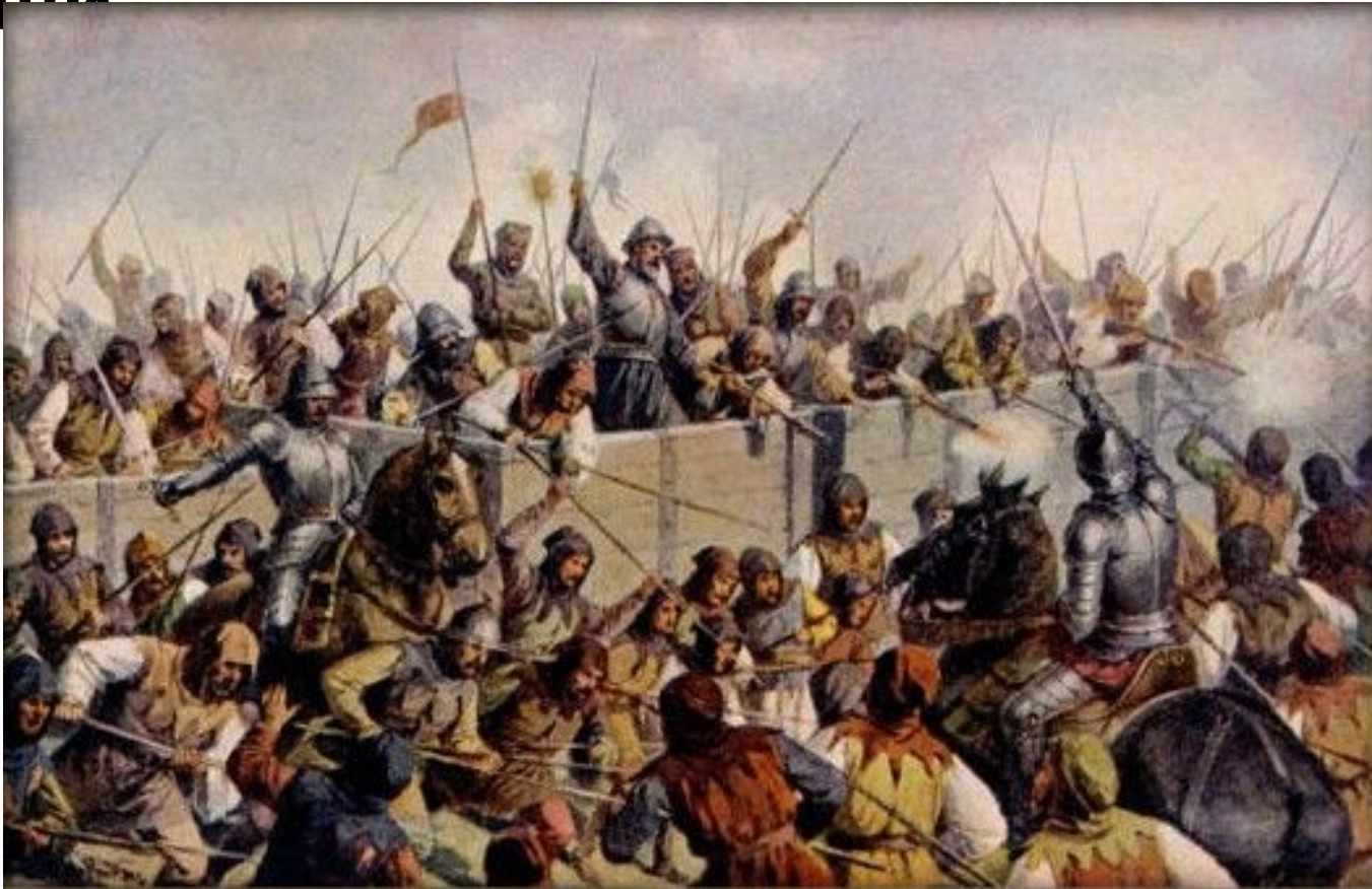
Битва под Липанами, Йозеф Матхаузер

Церковные власти вынуждены пойти на уступки, признав для Чехии право причащать мирян вином из чаши