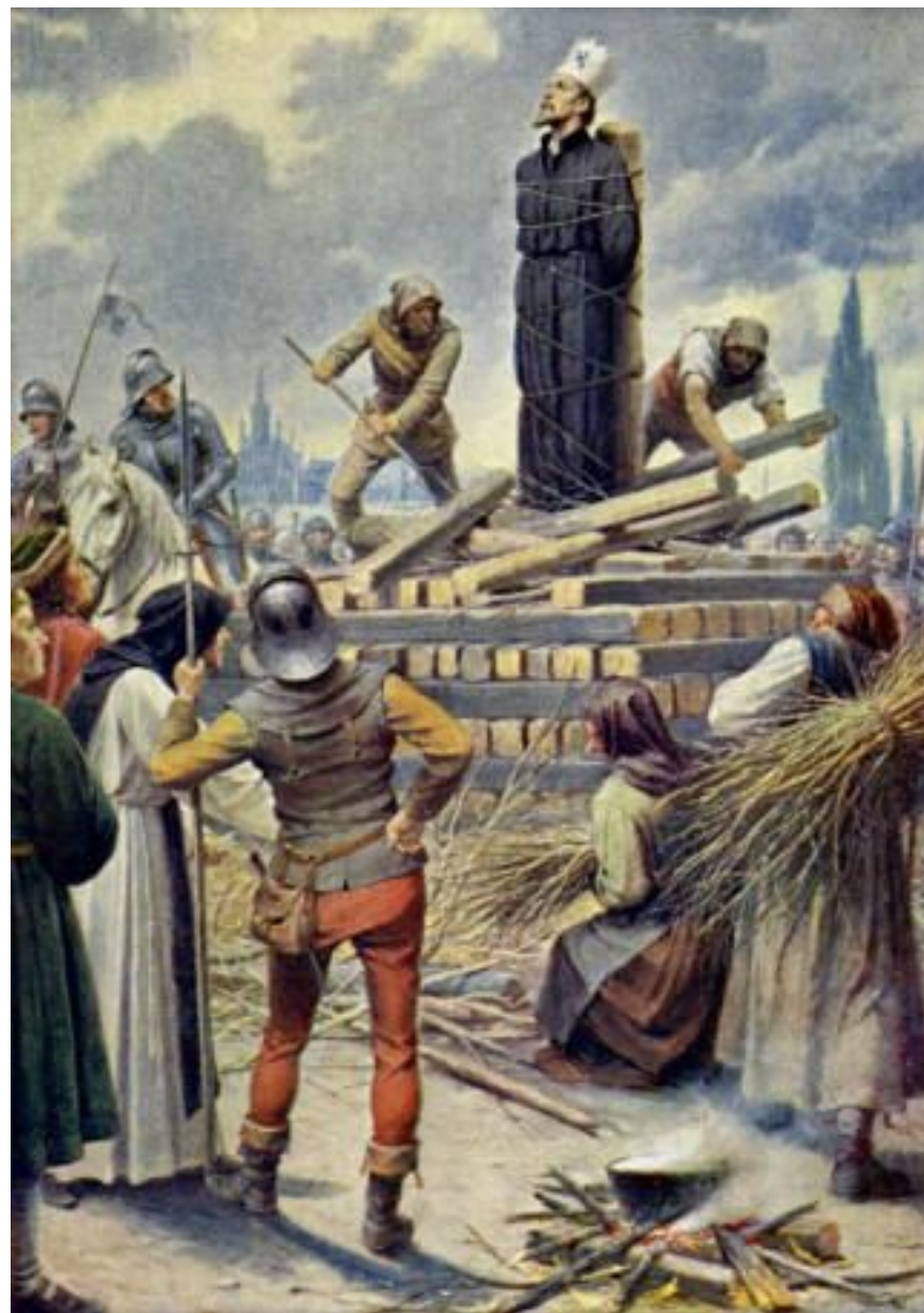
Владислав Муттих "Ян Гус на костре в Констанце",

После церковного собора в г. Констанц, Ян Гус объявлен еретиком. Гус не отрёкся от своих взглядов, за что был сожжён на костре в 1415 году.