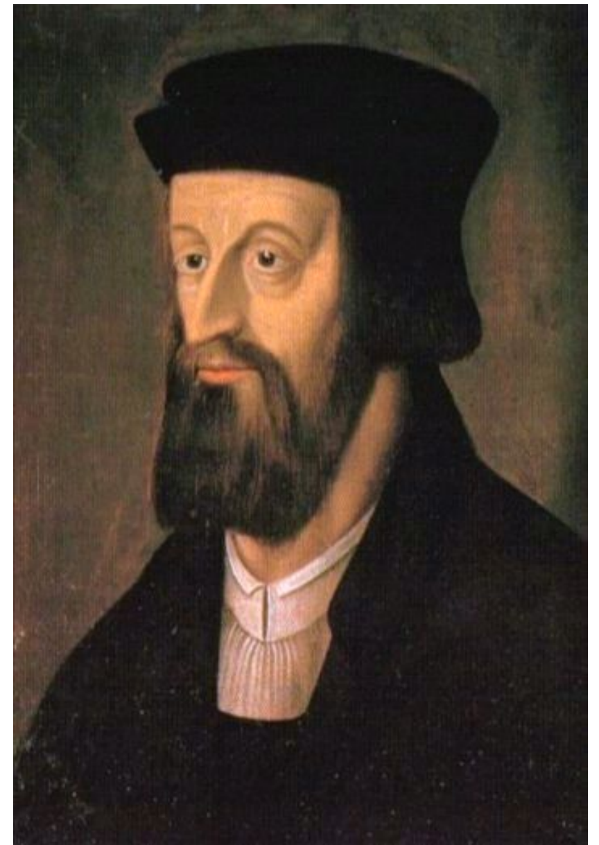
Ян Гус. Портрет неизвестного художника XVI

+ Осуждение роскоши феодалов и чрезмерного угнетения крестьян