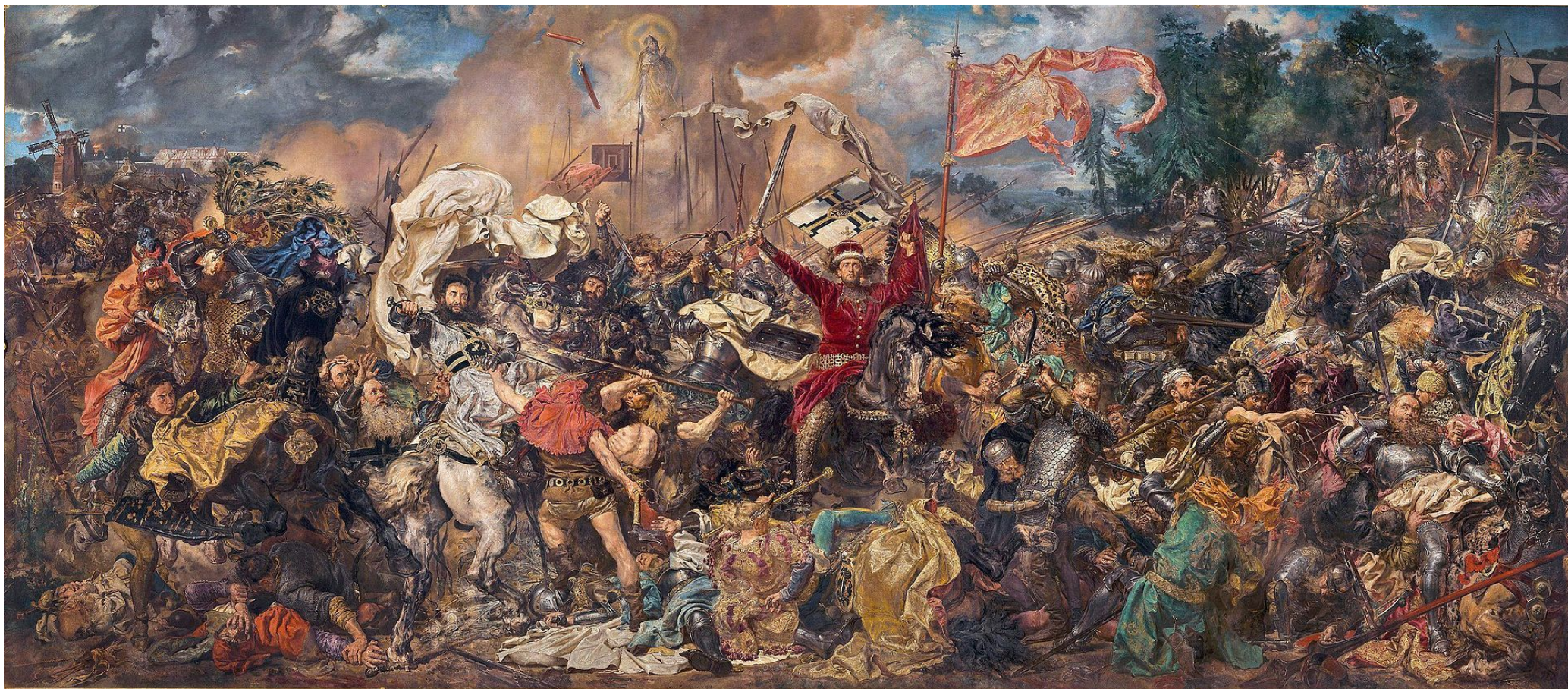
Грюнвальдская битва, Матейко Ян, 1878 г.

Грюнвальдская битва - 15 июля 1410 года.