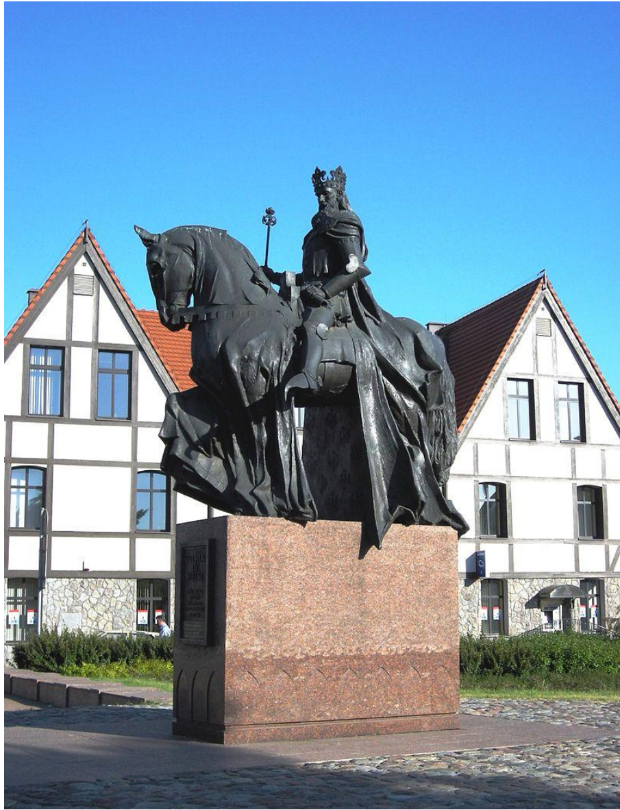
Памятник Казимиру Великому, г. Быдгощ, Польша, 2006 г.