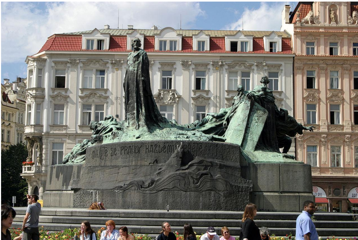
Памятник Яну Гусу, г. Прага, Чехия, 1915 г.