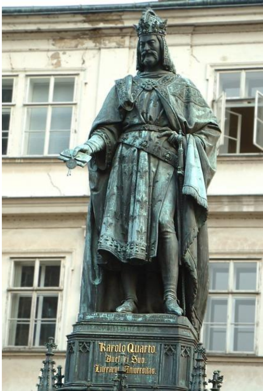
Памятник Карлу IV, г. Прага, Чехия, 1848 г.