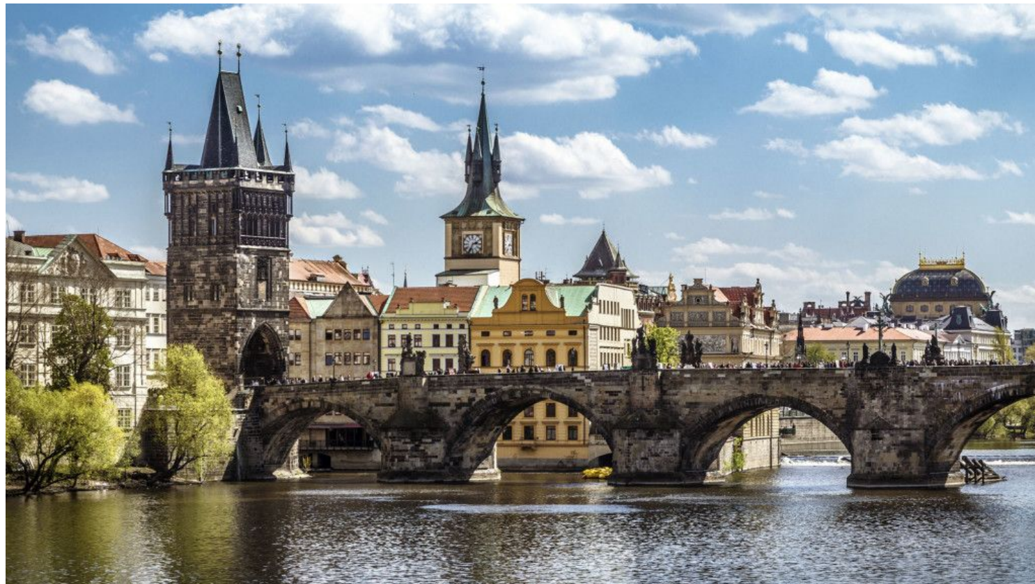
Карлов мост, г. Прага, Чехия, 1380 г.