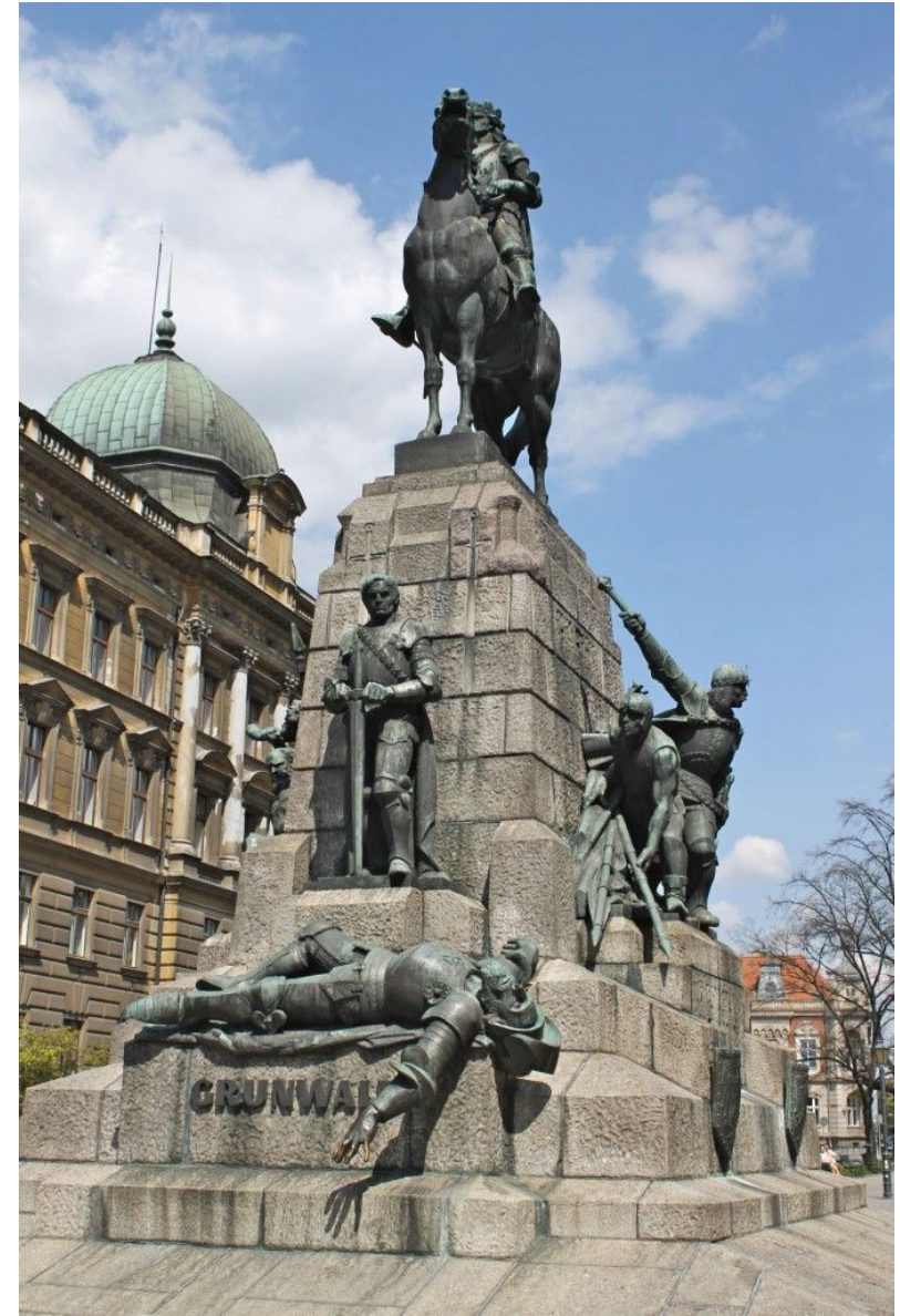
Памятник Грюнвальдской битве, г. Краков, Польша 1910 г.