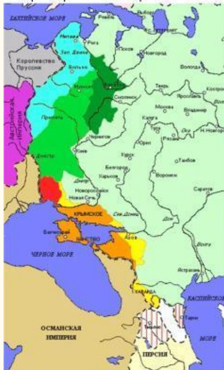
Расширение границ Российской Империи Во время правления Екатерины II Великой